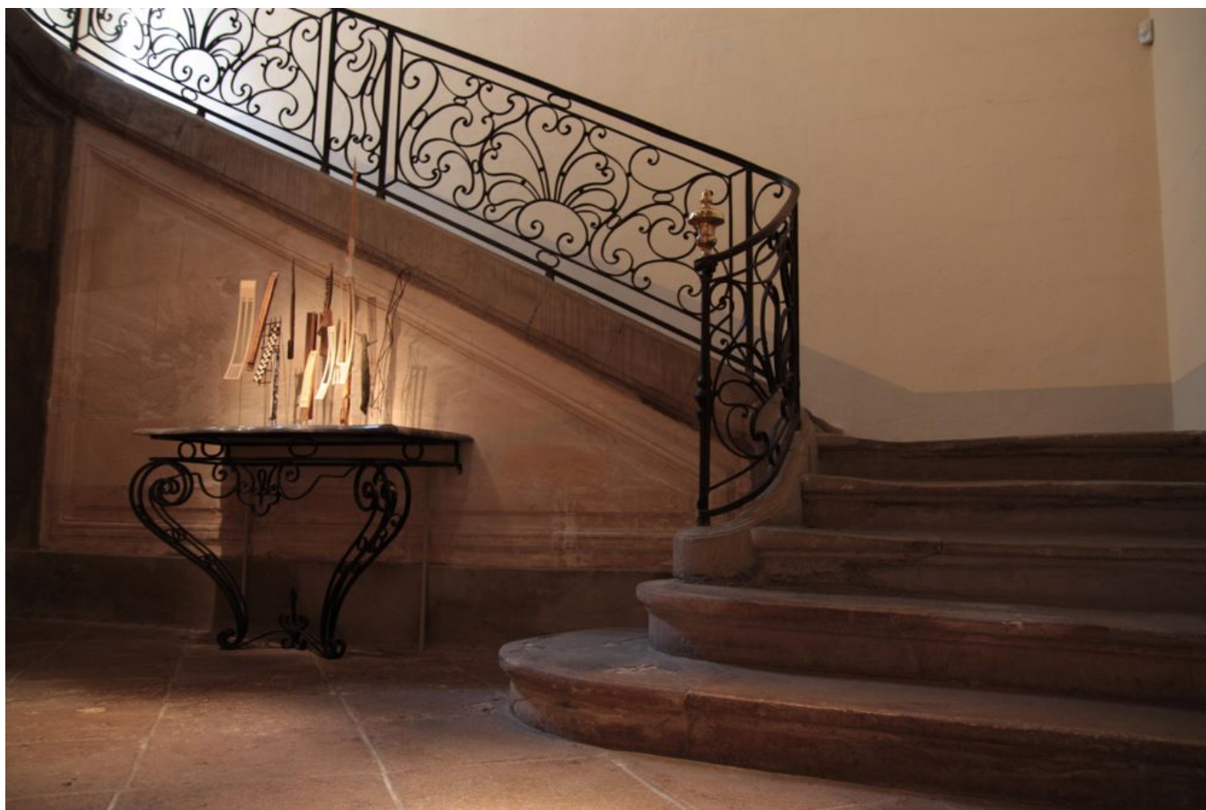
Les escaliers du centre seront nettoyées et restaurées

Quant aux 20 % restant du montant des travaux, ils sont à la charge de la commune, propriétaire du centre, qui propose chaque année des expositions d'art moderne et contemporain. Ce sont donc 12 710 € restant que la ville de l'Isle-sur-la-Sorgue souhaiterait atteindre avec l'aide de la campagne de souscription de la Fondation du Patrimoine . A ce jour ce sont 5841 € qui ont été récoltés par don à la fondation qui se donne pour but la préservation du patrimoine dans toute la France. L'objectif est d'atteindre 100% des derniers 20% du projet. La fondation rappelle qu'une partie des dons versés est déductible des impôts sur le revenu, de l'impôt sur la fortune immobilière et sur l'impôt sur les sociétés.