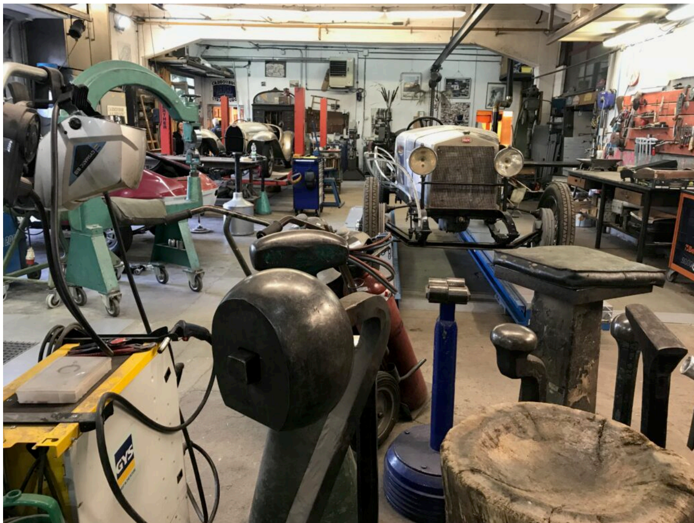
un atelier de restauration

du coin. La confiance est aussi un facteur important. Son « petit » garagiste c'est celui qui cherche à réparer plutôt qu'à changer, ou à ne remplacer que ce qui est nécessaire. Ces petites entreprises, qui sont les plus nombreuses, sont aussi les plus fragiles : forte pression concurrentielle, surcoûts énergétiques, problèmes de main d'œuvre, nécessité d'investir en permanence... Mais certains se battent pour continuer à exister, comme à Lourmarin où un jeune couple a repris un garage en se spécialisant dans les voitures anciennes ou de sport.