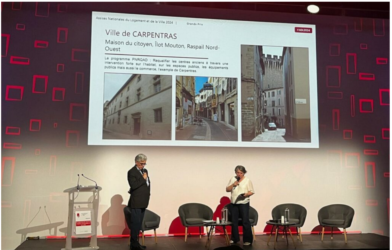
Le maire de Carpentras lors de la remise de prix.