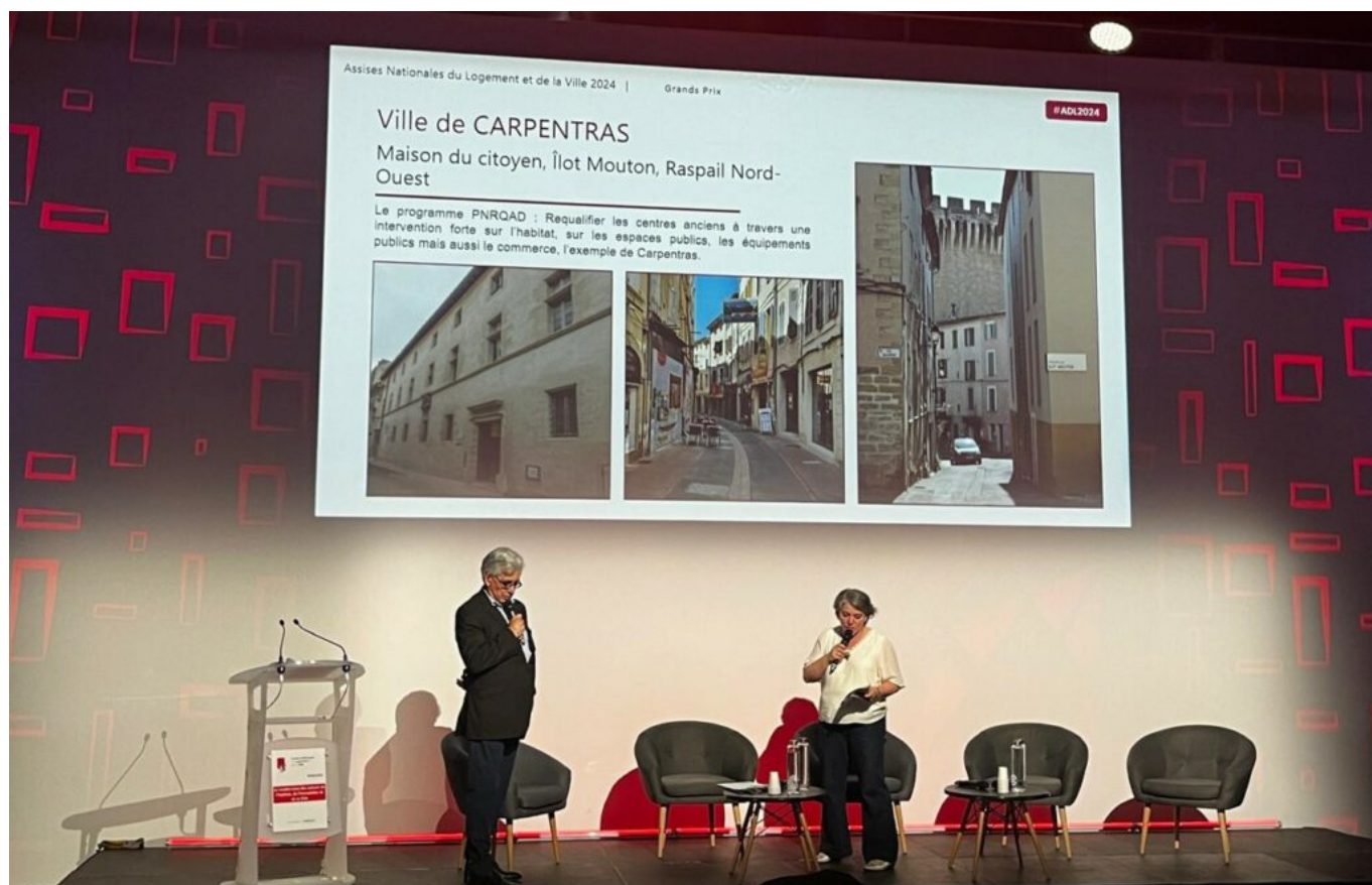
Le maire de Carpentras lors de la remise de prix.