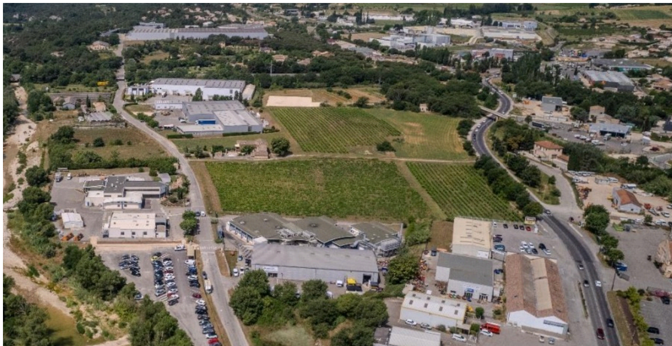
La zone industrielle Peyrolière.