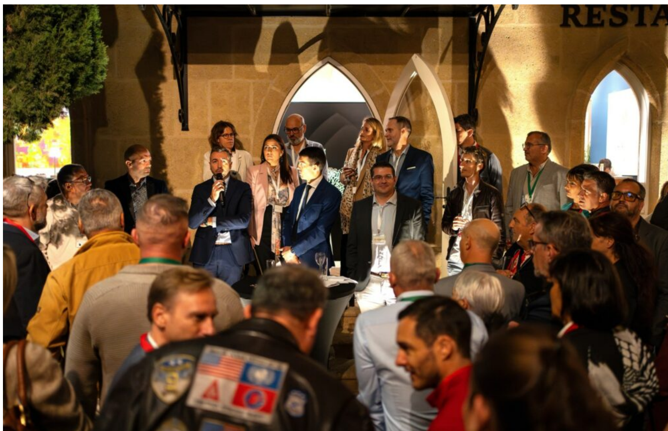
Une soirée grand format aux Fines Roches à Châteauneuf-du-Pape.

« Adhérer à un réseau de chef d'entreprise c'est un acte de bonne gestion. »