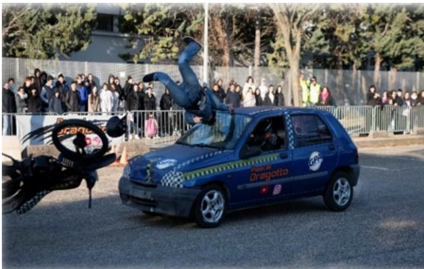
Exercice Sécurité routière