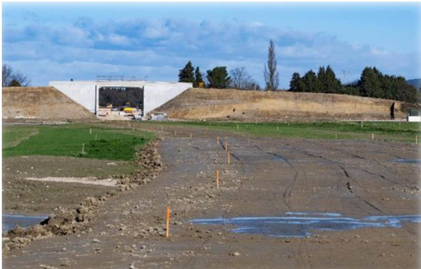
Terrassement du Chemin de Nogaret

collège Lou Vignarès à Vedène se poursuit : Les travaux de la phase 2, qui comprend la restructuration et l'extension des bâtiments administratifs, vont se poursuivre jusqu'en septembre 2025. La fin du chantier est prévue début 2026, après réalisation des aménagements paysagers et la dépose du collège provisoire.