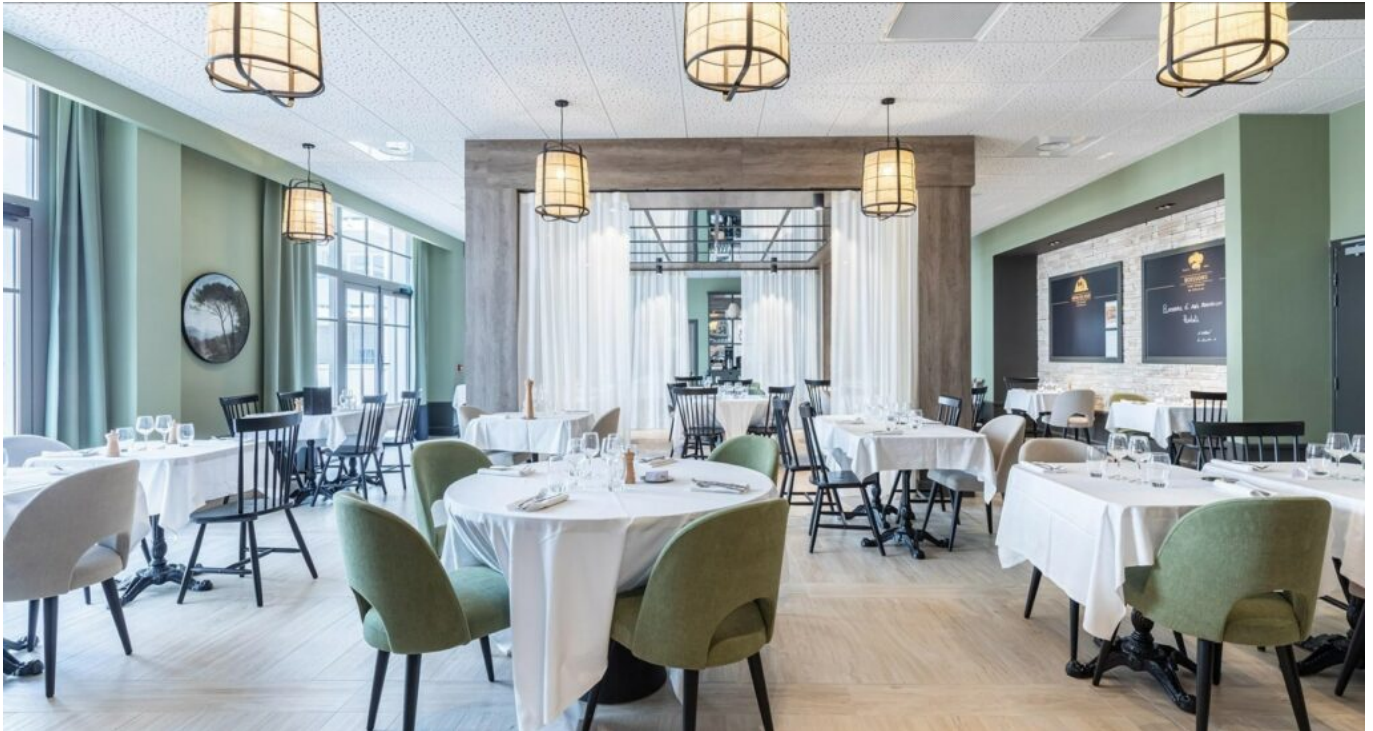
La salle de restaurant