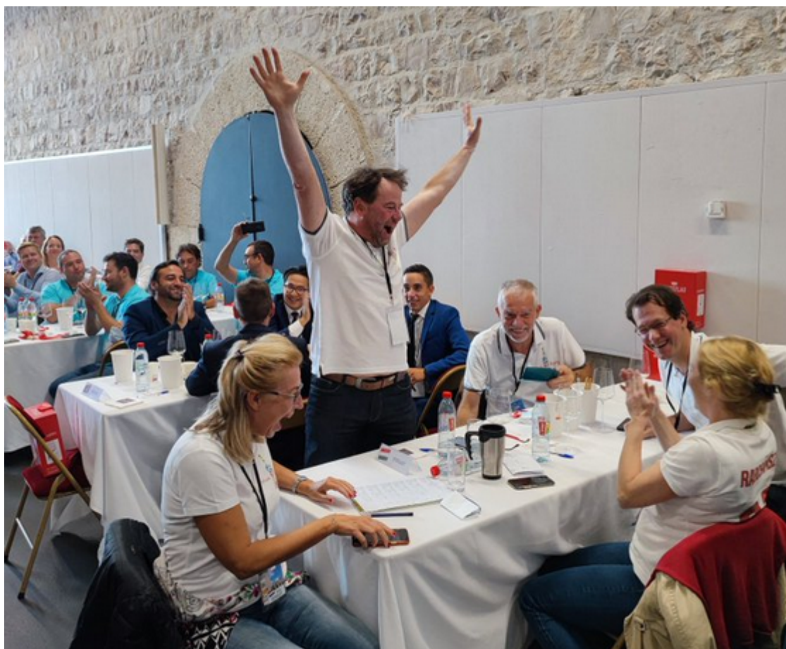
DR - Revue du vin de France