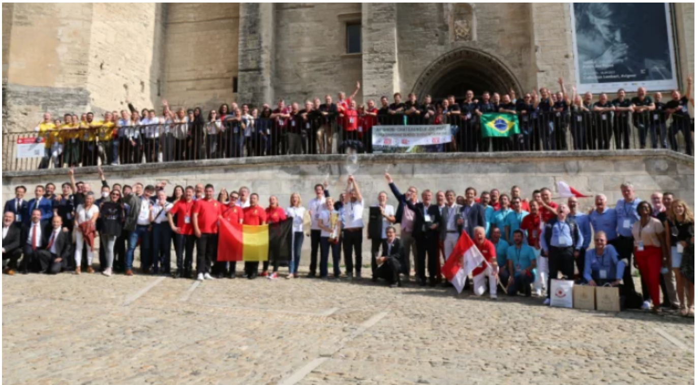
DR - Revue du vin de France

lors de la 9e édition de ce concours organisé par la Revue du vin de France qui vient de se tenir au palais des papes à Avignon à l'initiative du syndicat des vignerons de Châteauneuf-du-Pape. En tout, 27 équipes participantes, sélectionnées à l'issue d'un long processus de demi-finales régionales et de finales nationales tenues dans chaque pays, se sont affrontées autour de 12 vins. Chacune des équipes composée de 4 participants et un coach devait en reconnaître le cépage principal du vin, le pays d'origine, le millésime, le producteur, l'AOC.