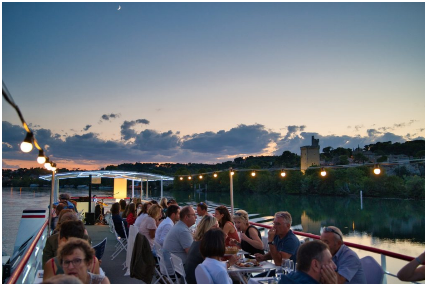
Le soleil se couche sur Villeneuve-lez-Avignon