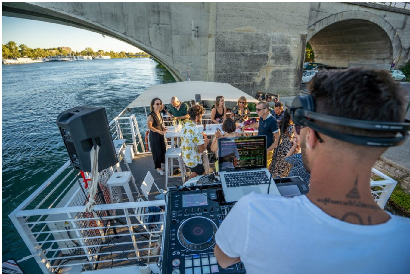
Planche et DJ au programme !