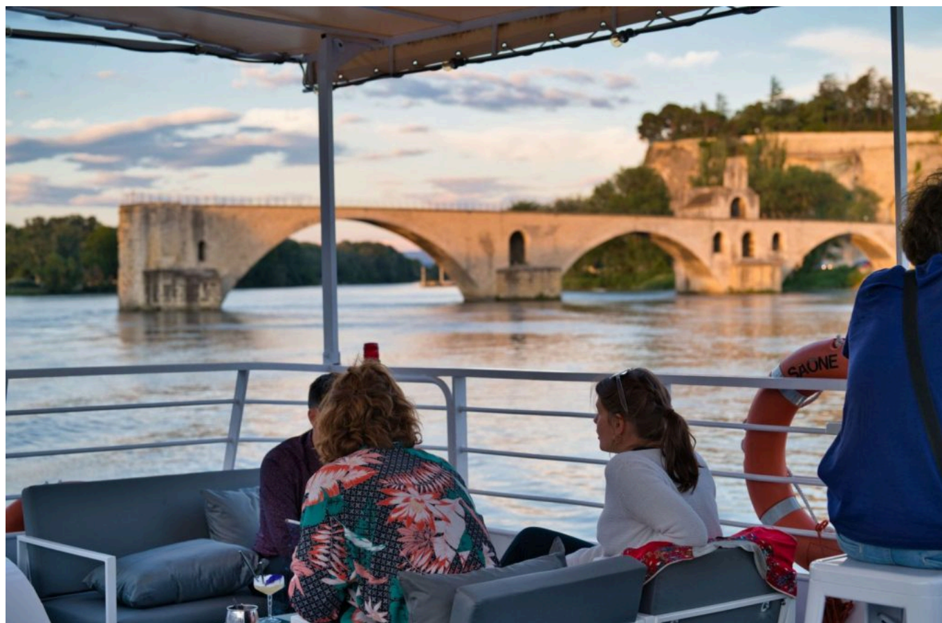
La terrasse du Mireio, havre de paix en fin de journée.

« C'est très compliqué en raison de la grosse coupure dans l'activité. Nous fonctionnons beaucoup avec les groupes, les entreprises, les associations, les clubs, qui pour des raisons économiques et sanitaires n'ont pas fait de réservation. » La compagnie a ainsi décidé d'adapter son offre à la clientèle individuelle locale. « Le Mireio a eu 4 mois d'activité alors qu'il fonctionne habituellement toute l'année. Cela représente 2/3 en moins sur nos chiffres. » Le directeur d'exploitation confirme avoir bien eu recours au PGE (Prêt garanti par l'Etat), au chômage partiel et aux différents dispositifs mis en place pour les restaurateurs et hôteliers. « On rattrapera le manque à gagner induit par la fermeture pendant plus de 6 mois. » L'état d'esprit demeure optimiste. Festival d'Avignon maintenu, Villeneuve en Scène , frontières internationales qui se délient, autant de signaux témoignant d'une reprise favorable. « A voir maintenant comment l'arrière-saison se profilera, est-ce que le Mireio sera contraint de fermer pendant la période hivernale ? », s'interroge celui qui chapeaute 12 collaborateurs à l'année et 40 en haute saison.