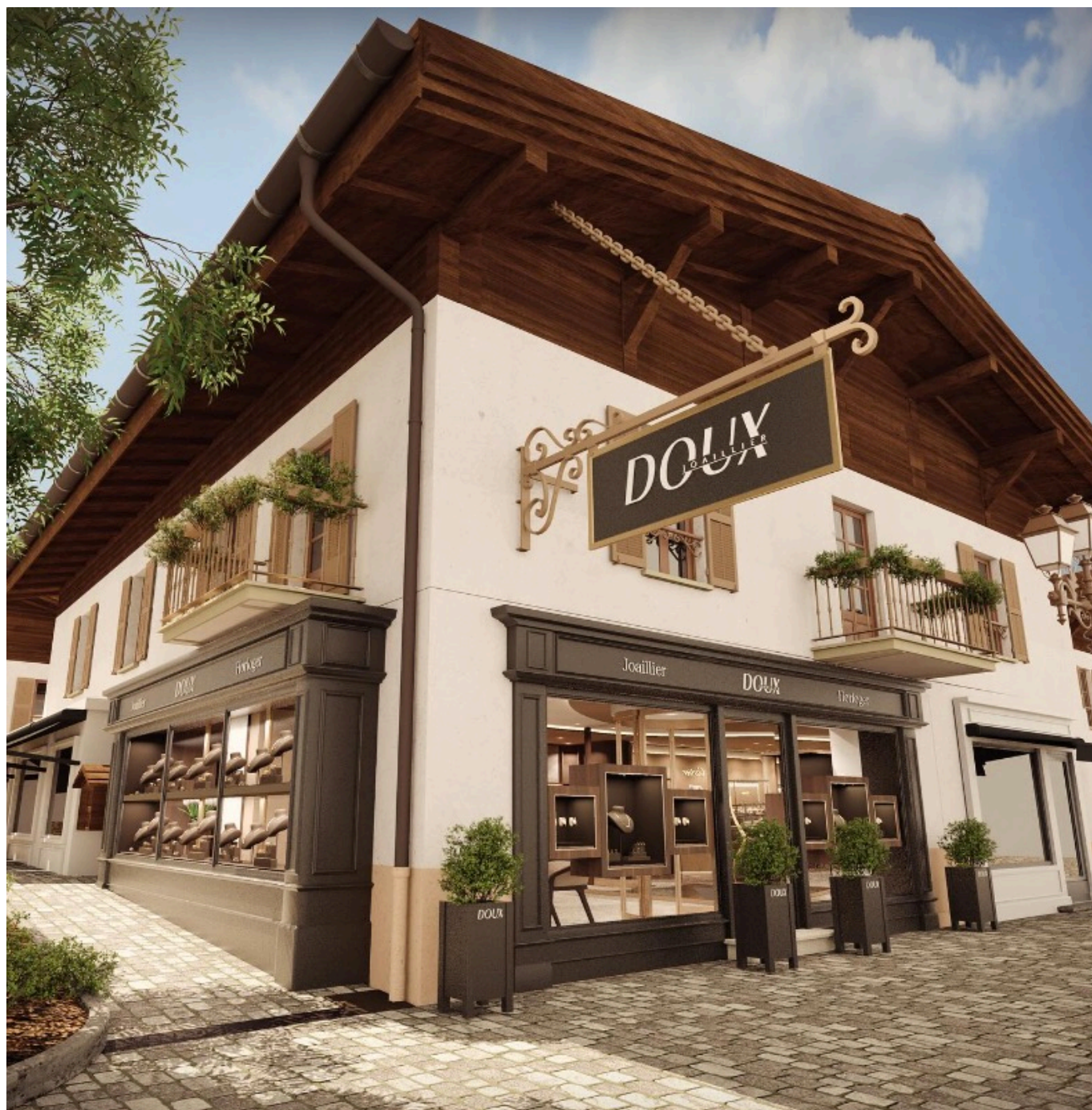
La future boutique Doux à Mégève