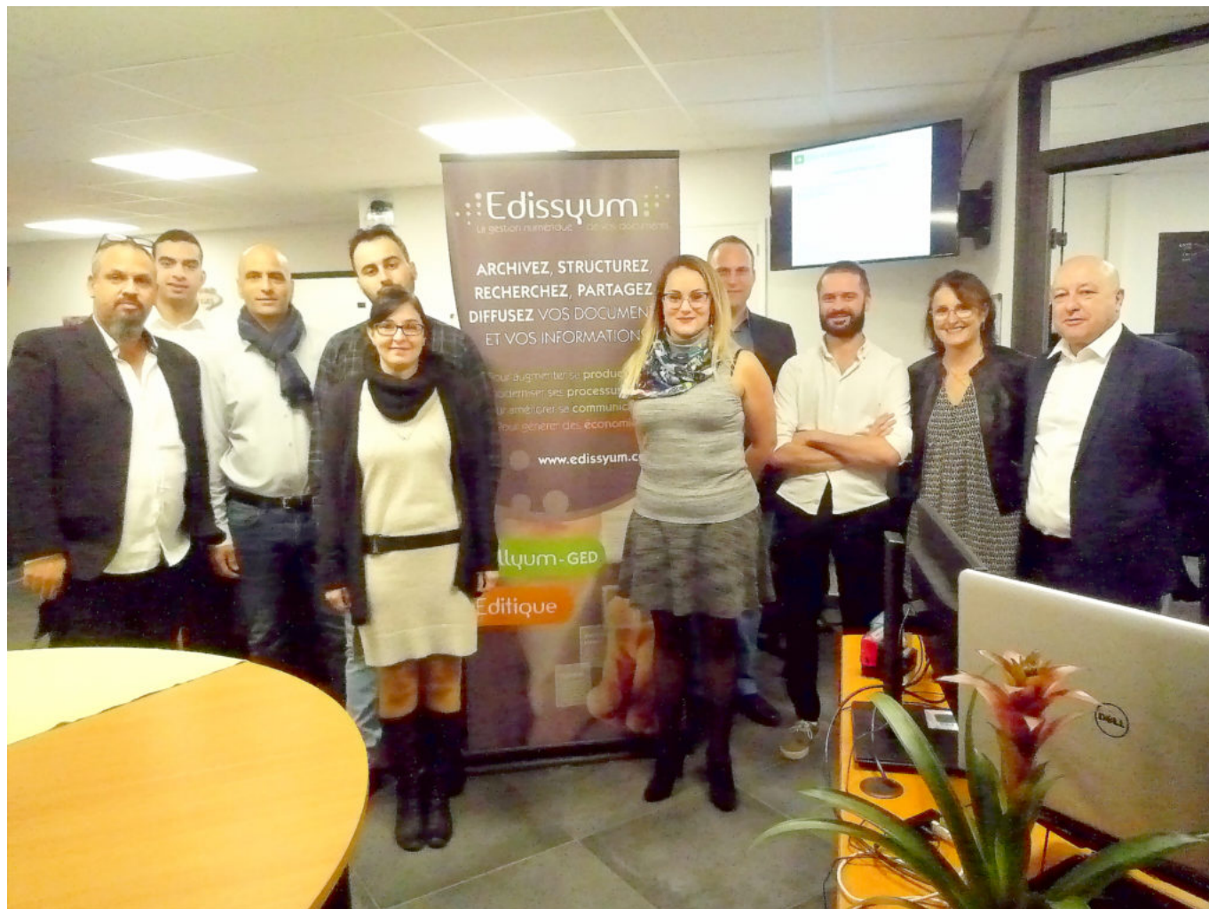
Les collaborateurs ont déjà pris leurs quartiers.

Plus d'informations, cliquez ici . Retour en images de l'inauguration :