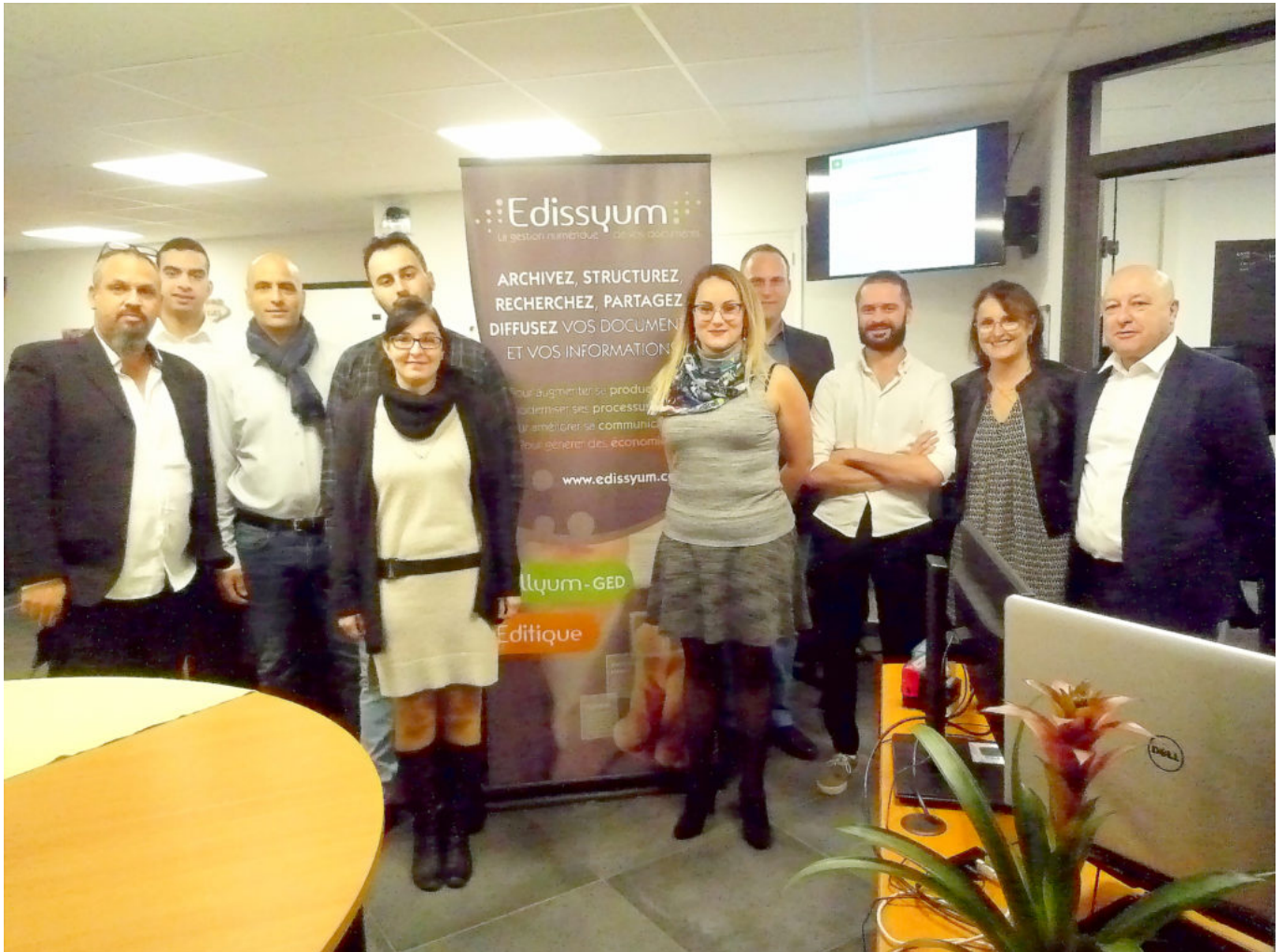
Les collaborateurs ont déjà pris leurs quartiers.

Plus d'informations, cliquez ici . Retour en images de l'inauguration :