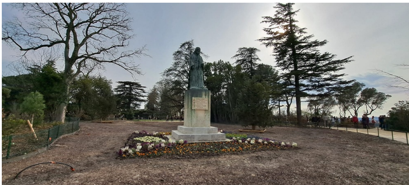
La statue de Jean Althen