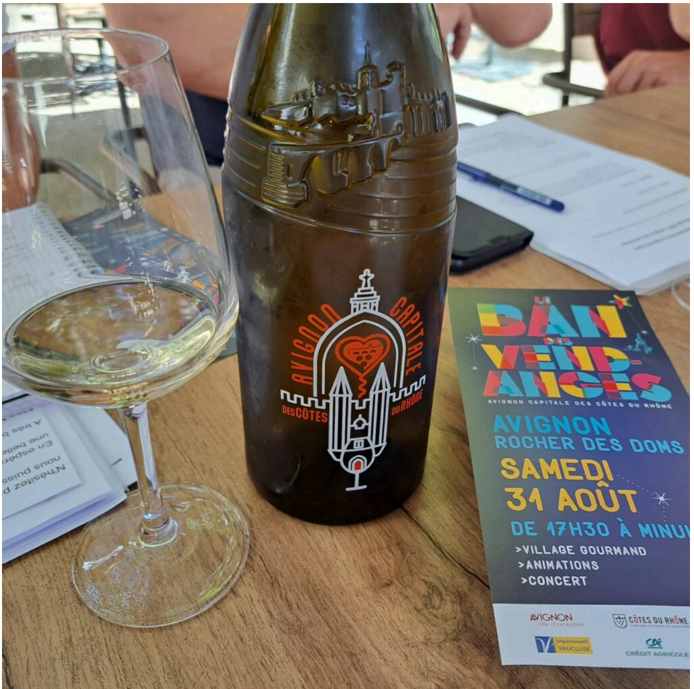
La bouteille 'Avenio'

'Avenio' la bouteille des Côtes du Rhône, vedette du Ban des Vendanges le 31 août