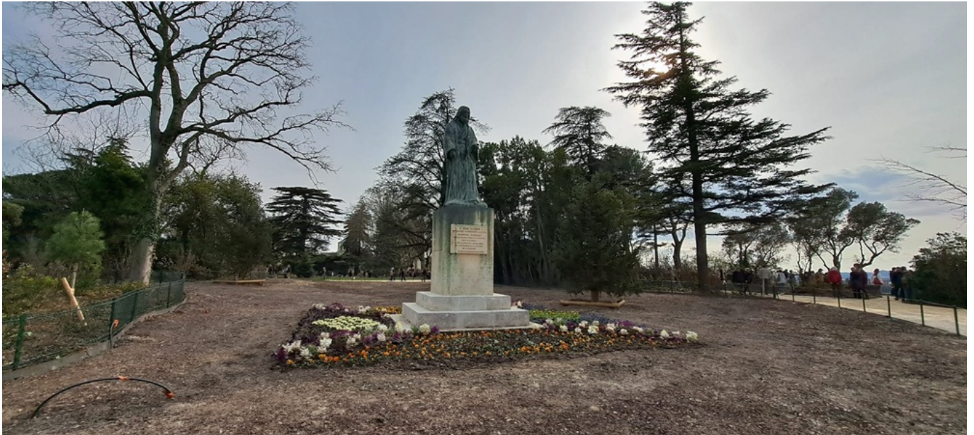
La statue de Jean Althen