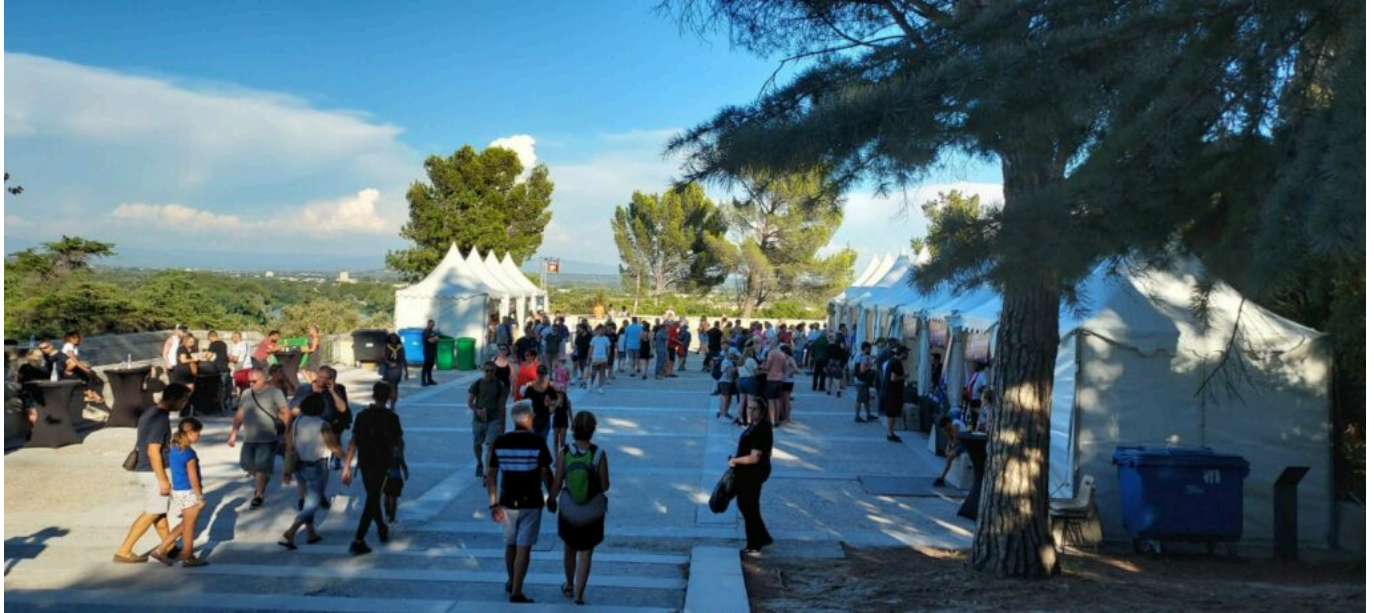
Les stands de dégustation

Contact : www.compagnonscotesdurhone.fr et 04 90 16 00 32 Réservation ici .