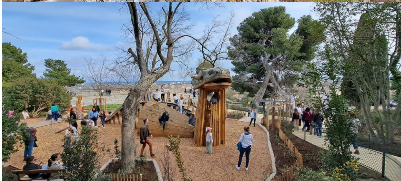
Le drac en bois de 4m de haut avec toboggan et prises d'escalade pour les 6-12 ans