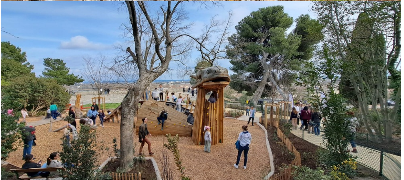
Le drac en bois de 4m de haut avec toboggan et prises d'escalade pour les 6-12 ans