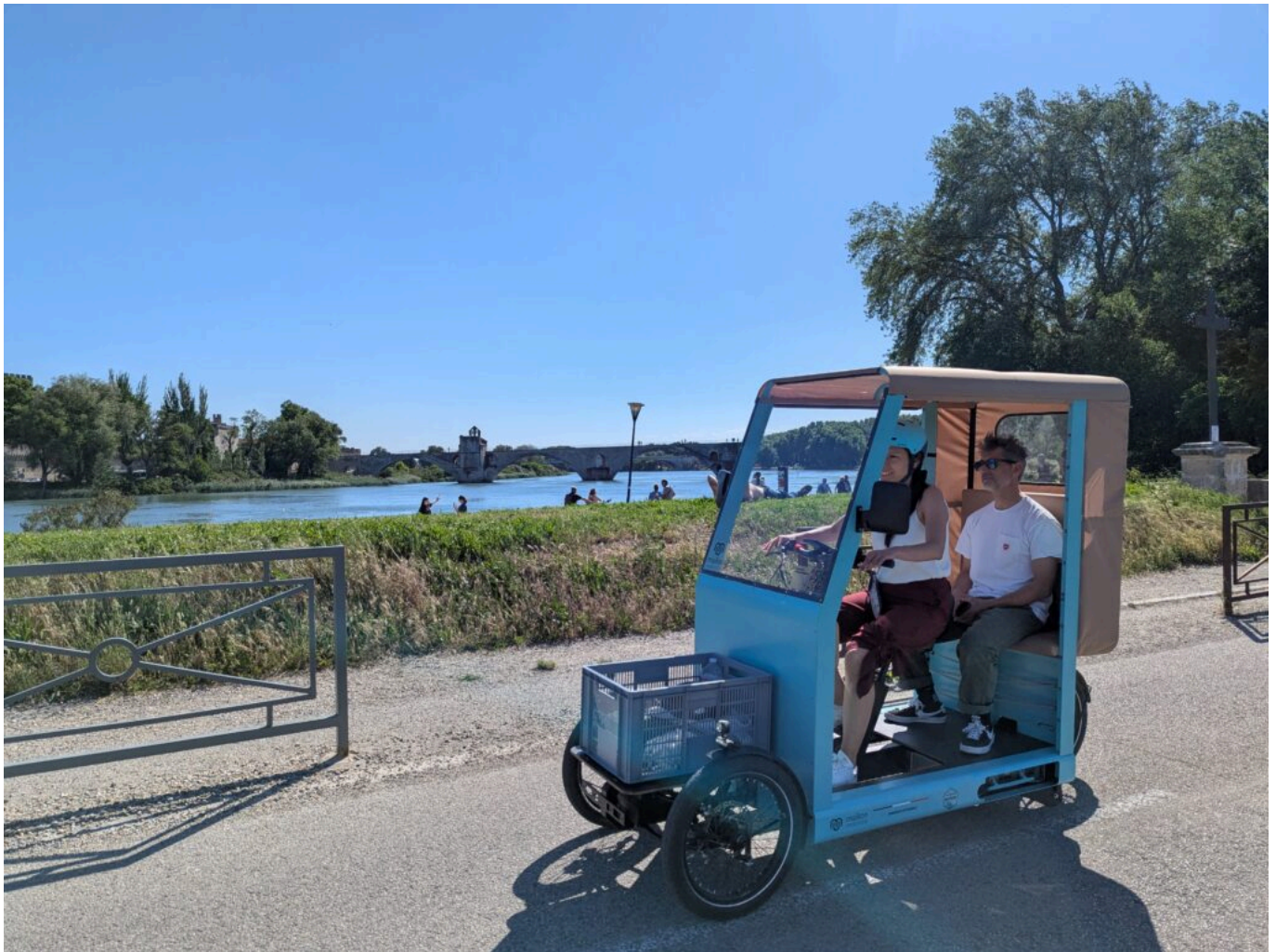
Maillon, Véhicule intermédiaire.