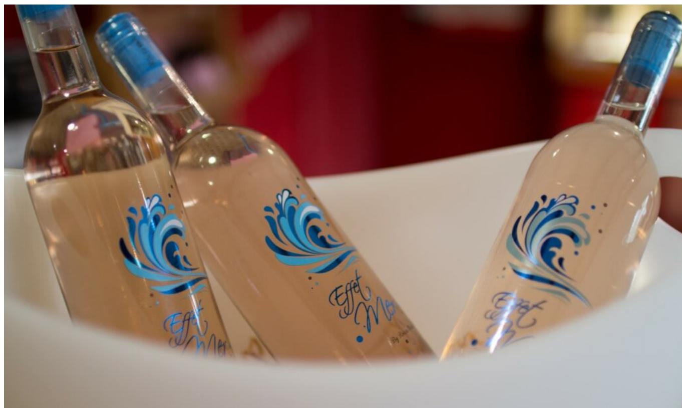
La cuvée 'L'Effet Mer'.