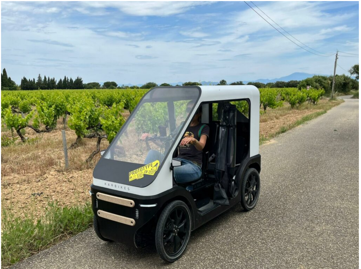
Karbikes, véhicule intermédiaire.

Le karbikes arbore 4 roues et est dévolu aux déplacements urbains et périurbains. A mi-chemin entre le vélo et la voiture, il propose une assistance électrique et nécessite le pédalage. Sa structure fermée protège le conducteur des intempéries. Il peut atteindre les 25km/h. Il est développé à Strasbourg.