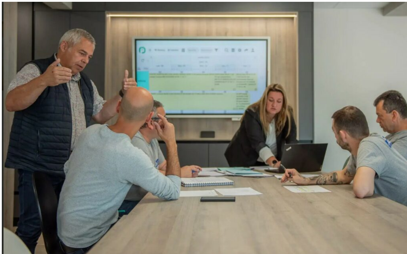
Une des équipes d'Alu Vaison

«Devenu ingénieur, j'ai travaillé dans de grands groupes tels que Bouygues et Vinci. C'est là que j'ai appris mon métier. Puis, alors que je travaillais chez Vinci, un nouveau dirigeant est arrivé. Je n'avais pas envie de rester, même si je n'avais pas tout à fait encore un projet en tête. Nous nous sommes quittés dans de bonnes conditions. Un an plus tard je reprenais, via le C.R.A. délégation d'Avignon, Alu Vaison.»