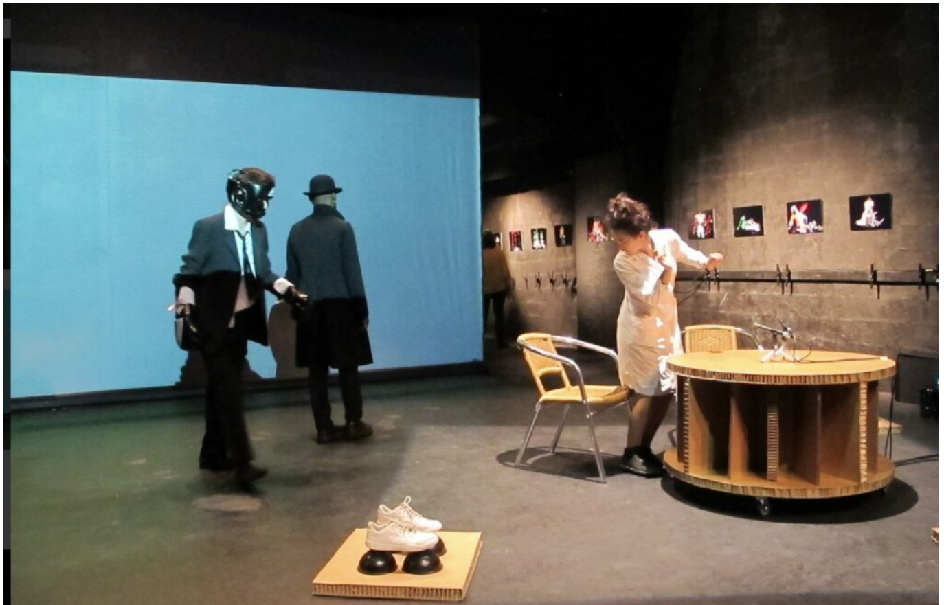
Le volet artistique de Volubilis