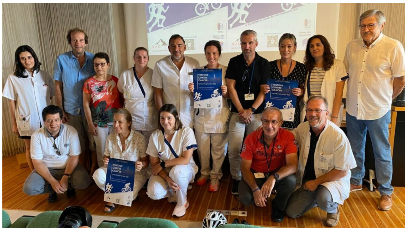
Quelques membres des deux équipes de Sainte-Catherine

Chaque participant doit maintenant collecter des fonds sur le principe du crowdfunding ou financement participatif pour être présent sur la ligne de départ : 275€ minimum par adulte / 100€ par enfant (de 14 à 18 ans), l'entièreté des dons collectés seront attribués au projet 'Guérir du cancer du rectum sans mutilation' de Sainte-Catherine.