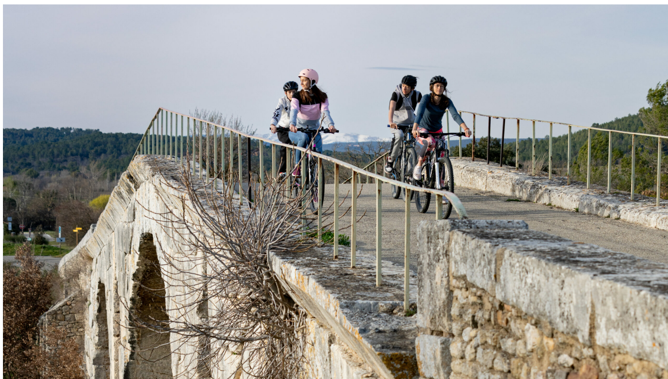
Sur le Pont Julien et la Véloroute du Calavon

Dans le Vaucluse c'est 400 km d'itinéraires balisés sur routes dédiées ou partagées, avec 3 véloroutes ( ViaRhôna , Calavon et Via Venaissia ), c'est 5 boucles et un grand tour du Luberon (240 km à lui seul). Côté tout-terrain on n'est pas en reste avec 33 itinéraires en VTT et 15 en VTC, dont la très exigeante traversée du Vaucluse en VTT (400 km et 10 000 mètres de dénivelé positif).