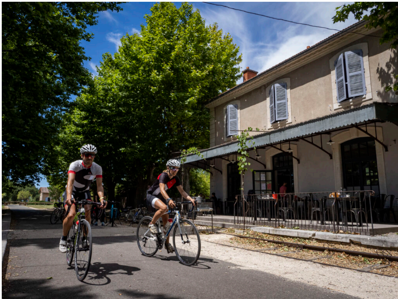
Gare de Loriol-du-Comtat sur la Via Venaissia

L'évolution du nombre de loueurs de vélos est également un autre indicateur intéressant. Leur nombre est passé de 10 à 20 en quelques années. Le réseau de professionnels affilié à l'association Vélo Loisir Provence, compte aujourd'hui, 56 hébergeurs, 20 loueurs, 8 restaurants, 8 caves, 5 accompagnateurs, 5 agences de voyages et 3 transporteurs. Certains bâtiments comme les anciennes gares SNCF de la vélo route du Calavon sont transformées en restaurants ou en lieux d'exposition culturel. C'est tout un éco système qui est en train de se constituer autour du vélo.