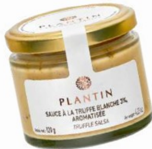
Sauce à la truffe blanche 3%