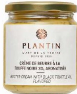
Crème de beurre à la truffe noire 3%