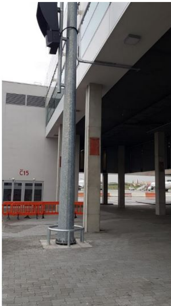
Budapest Hongrie : poteaux pour systèmes de guidage visuel d'amarrage aéroportuaire.