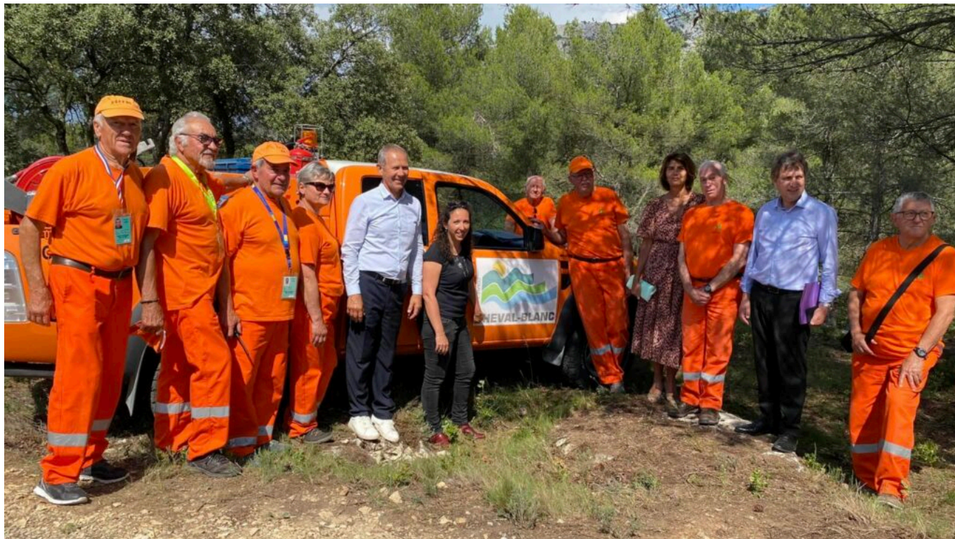
Les élus avec les bénévoles du CCFV de Cheval-Blanc.

incendiaires se retrouvent devant un tribunal ».