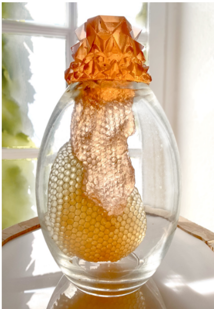
Œuvre de Sati Mougard