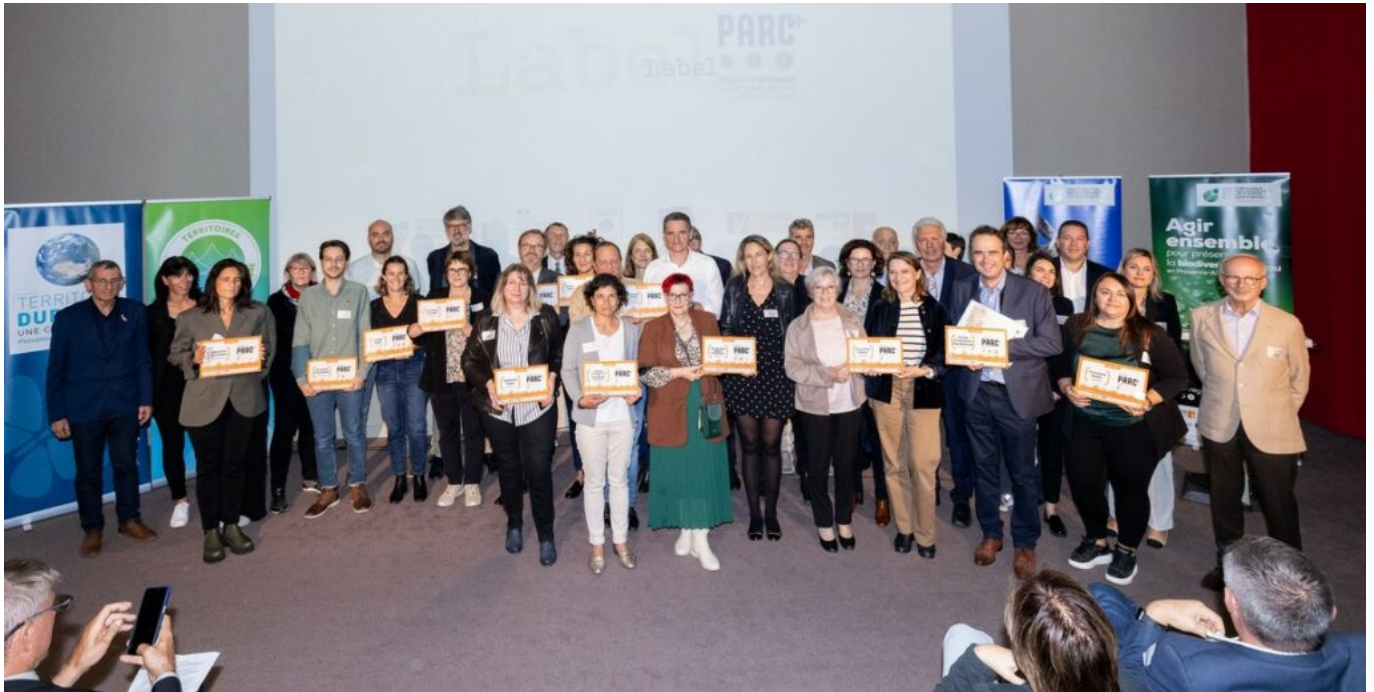
Les lauréats du label+.

aéronautique Pégase à Avignon et le MIN (Marché d'Intérêt National) d'Avignon