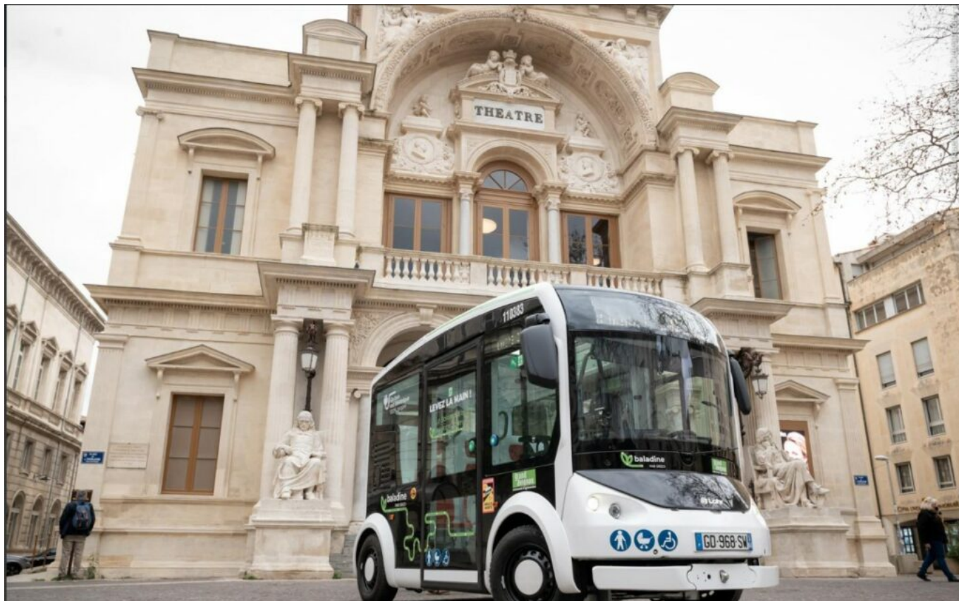
La baladine est gratuite depuis Juillet