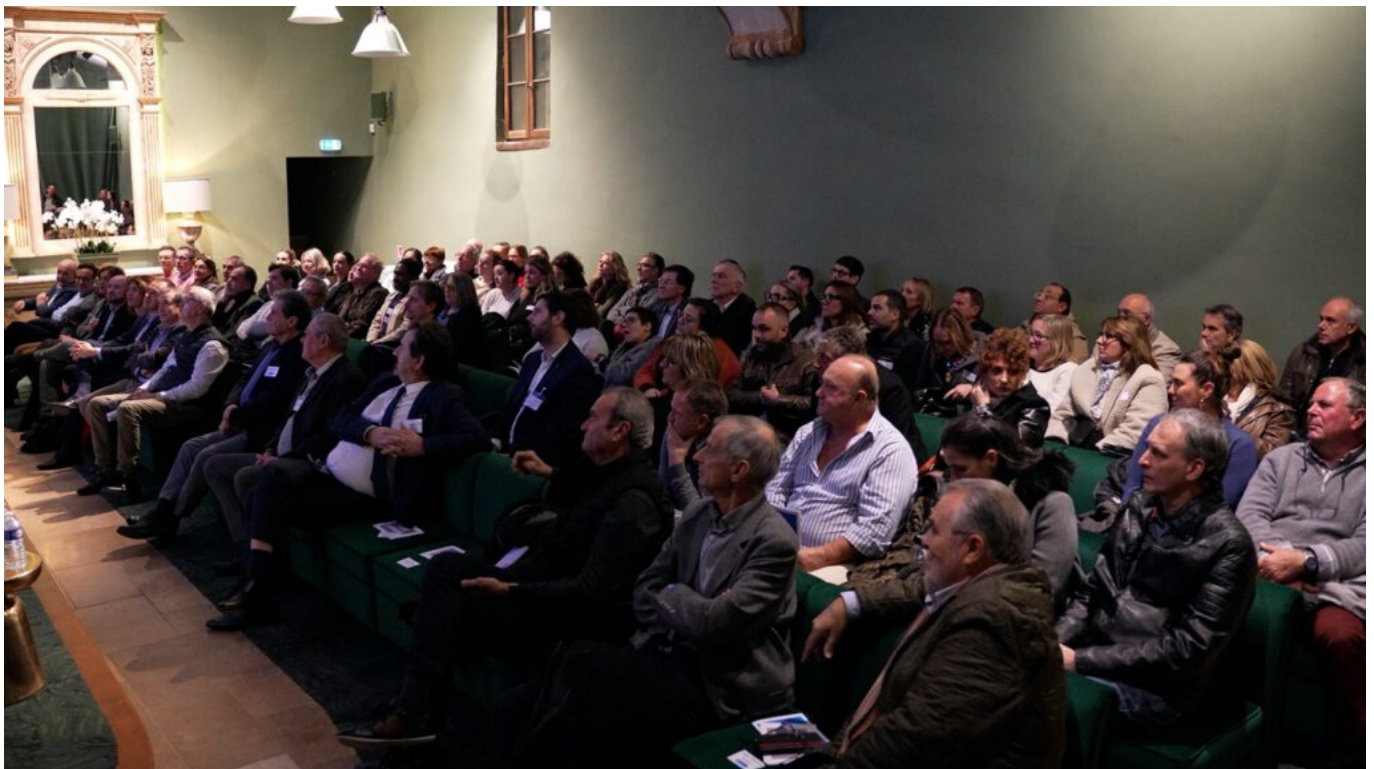
Salle comble pour la 1 re Nuit de commerce de proximité.

Cette soirée, réalisée en partenariat avec le SCAD Lacoste, a été sous le signe du business, des tendances, de l'humain, et bien évidemment du commerce. Les objectifs de l'événement était de réunir les commerçants du territoire, impulser de l'énergie positive et échanger sur les nouvelles tendances du commerce d'aujourd'hui et de demain.