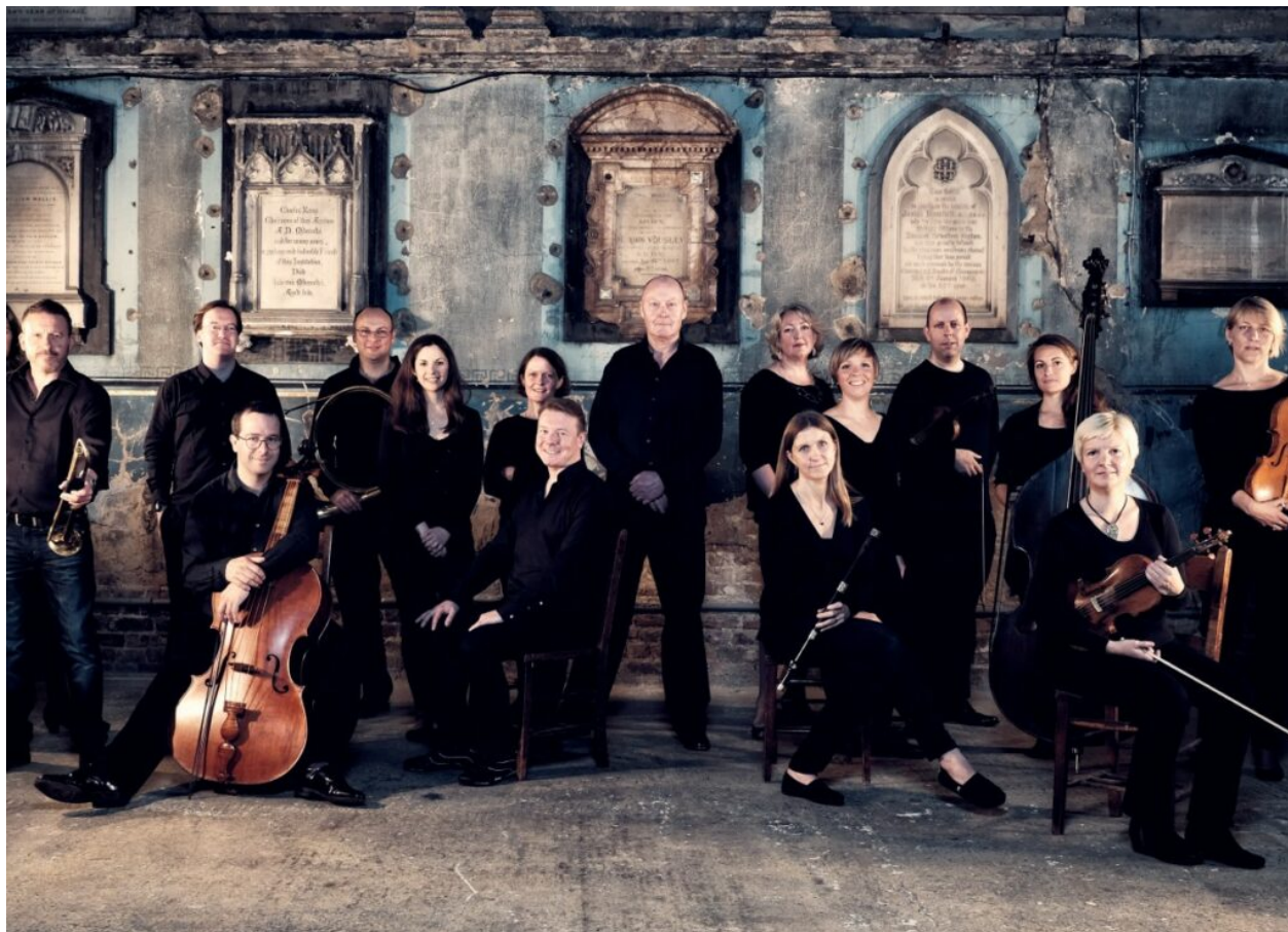
“King Arthur” par le Gabrieli Consort le 09 juillet place de l’Horloge à Ménerbes