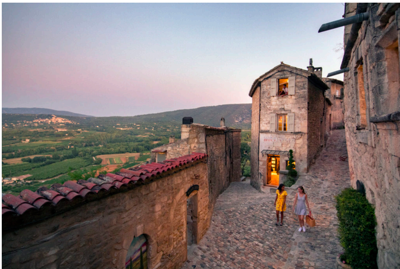
SCAD Lacoste, été 2019, rue du Four.