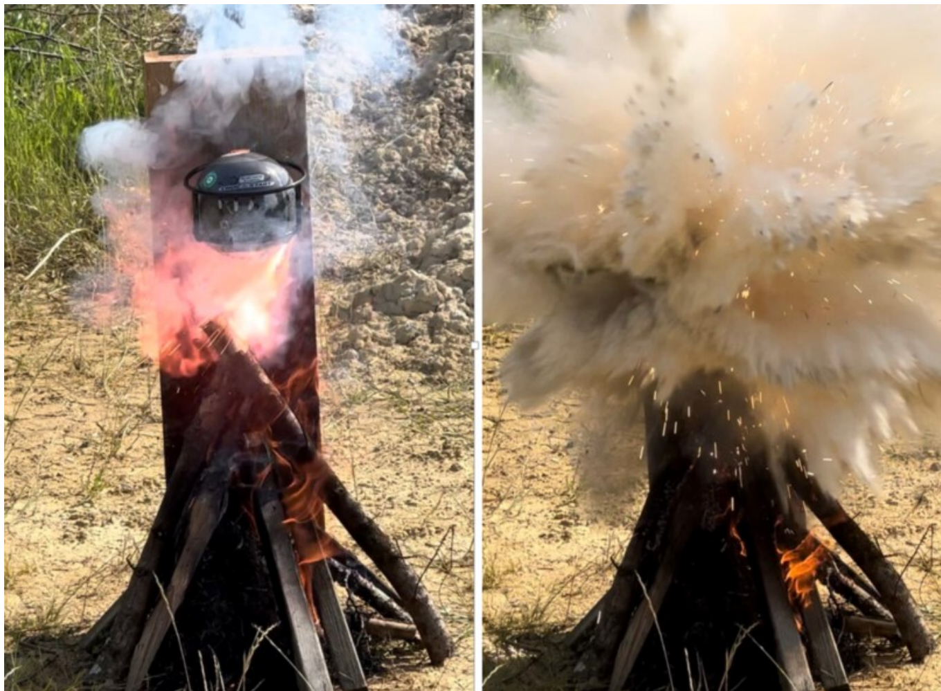
Le Block'Fire en situation réelle.

pèse qu'1,3kg pour 15cm de diamètre. La boule extinctrice est munie d'une languette de sécurité que l'on retire et que l'on lance à proximité ou dans le feu, où elle éclatera à l'impact et éteindra le feu. Elle ne nécessite pas d'entretien ni de vérification comme c'est le cas pour les autres extincteurs. Au terme de 5-6 ans, alors que la durée de vie des extincteurs est de deux ans, vous ouvrez votre boule et vous fertilisez votre jardin, votre potager ou vos bacs de jardinerie avec son contenu.»