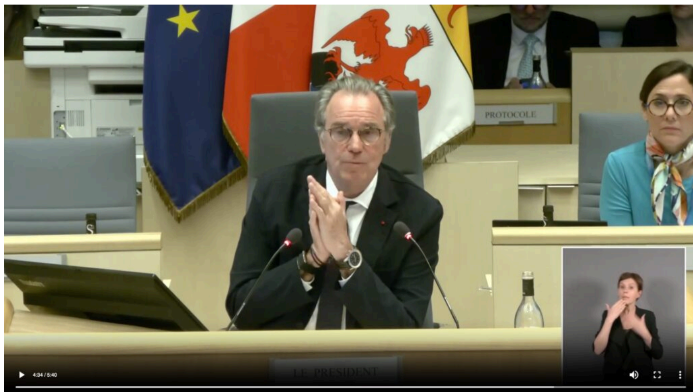
Renaud Muselier lors de la dernière séance plénière de la Région Sud.

« Il faut traiter le problème de gouvernance avant le problème de vision. »