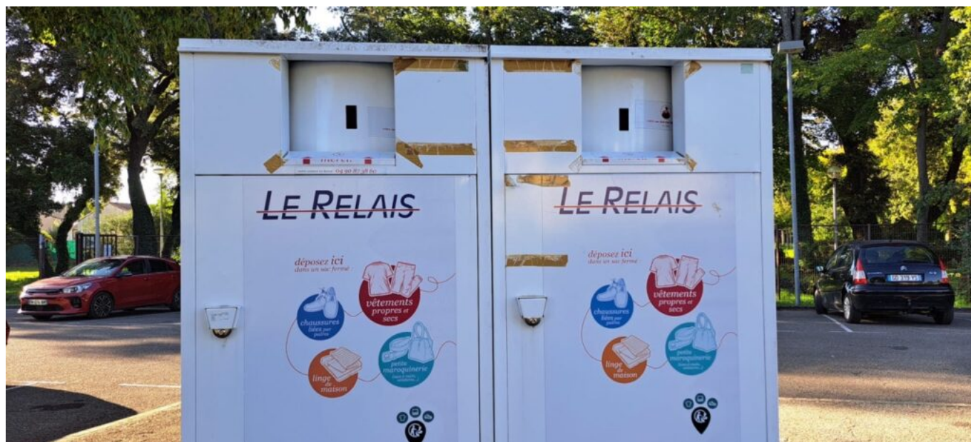
Les points de collecte textile du réseau Le Relais.

Initié au départ en 1984 dans le Pas-de-Calais avec la crise, il n'a fait que se développer sur l'ensemble de l'Hexagone avec aujourd'hui 80 boutiques Ding Fring sur le territoire. « Les articles en excellent état sont remis en vente. Pour le reste, 55%, sont exportés vers l'Afrique (Sénégal et Burkina-Faso) et Madagascar. 6% deviennent des chiffons et ce qui est vraiment abîmé est réduit en granules qui servent de combustible aux cimenteries, rien ne perd », conclut David Fillon.