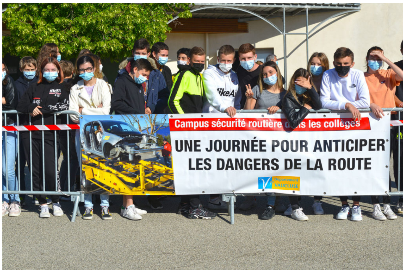
Cinq collèges auront droit à une journée de sensibilisation routière.

En début de matinée, les collégiens assistent à des démonstrations sur les distances de sécurité ou de freinage. Dans un second temps, à une simulation d'accident entre un véhicule et un motocycliste effectuée par un pilote professionnel du risque automobile. Les élèves participent ensuite à des ateliers thématiques de 50 minutes choisis par leur établissement scolaire. Les prochains collèges à bénéficier de cette journée seront le collège Alphonse Silve à Montoux (mardi 1er juin 2021), le collège Paul Gauthier à Cavaillon (le jeudi 3 juin 2021) et le collège Marcel Pagnol à Pertuis (le vendredi 4 juin 2021).