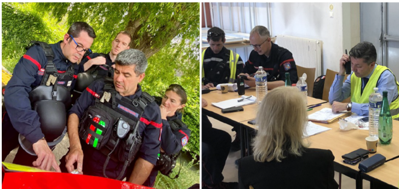
À gauche, les pompiers de Vaucluse, à droite, Bertrand Gaume, le préfet du département à la manœuvre.