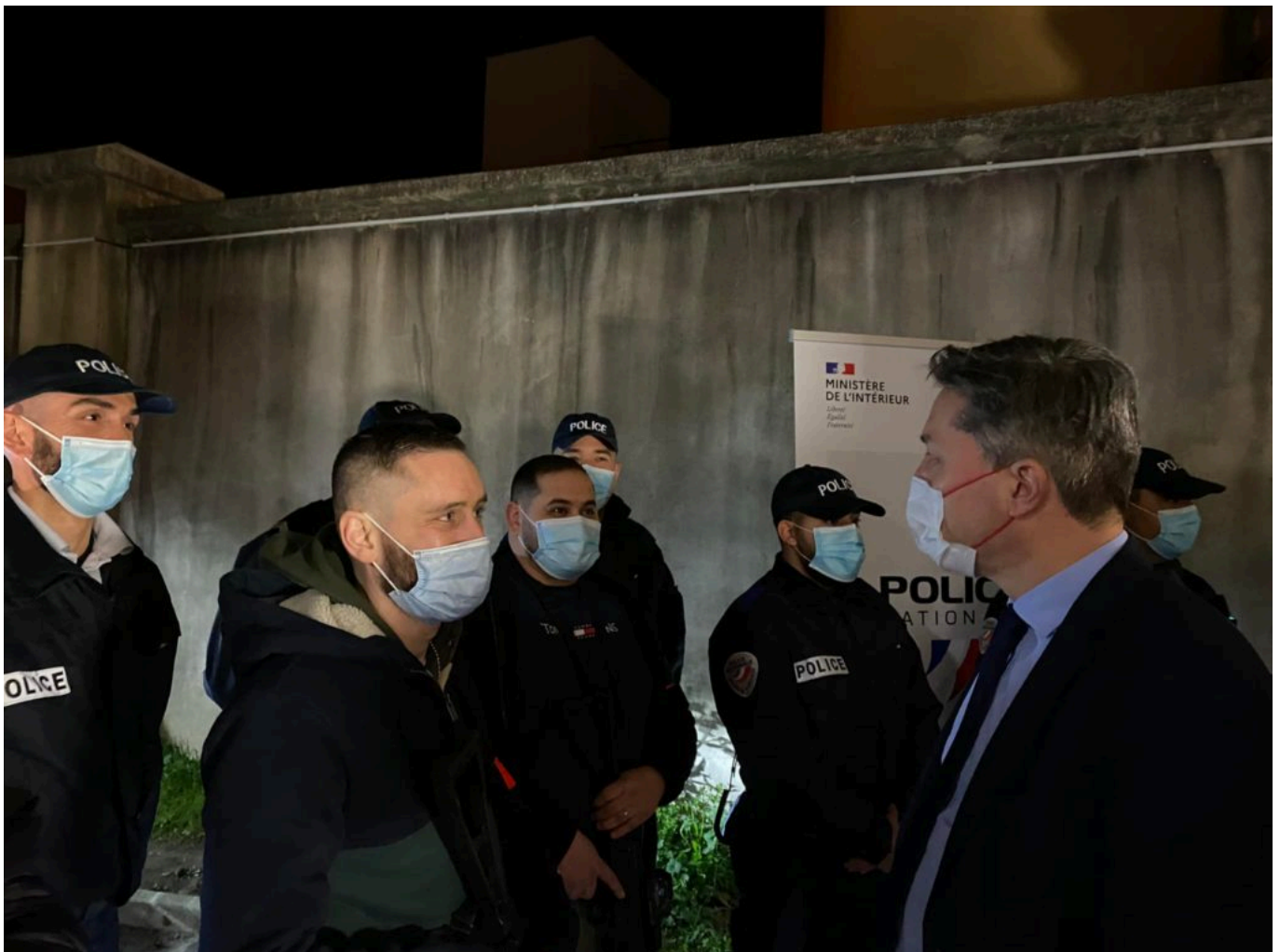
Le préfet de Vaucluse salue les fonctionnaires du groupe de sécurité de nuit à Cavaillon.

« Le 22 juillet dernier, j'interpellais, au Sénat, M. le ministre de l'Intérieur pour lui demander des moyens et des effectifs suffisants pour lutter efficacement contre le trafic de drogues à Cavaillon et notamment, la création d'un groupe de sécurité de proximité. Sept mois plus tard, je suis venu les accueillir au commissariat, a commenté le sénateur LR Jean-Baptiste Blanc . Leur arrivée est un acte fort qui nous l'espérons tous permettra le retour de l'ordre républicain à Cavaillon. »