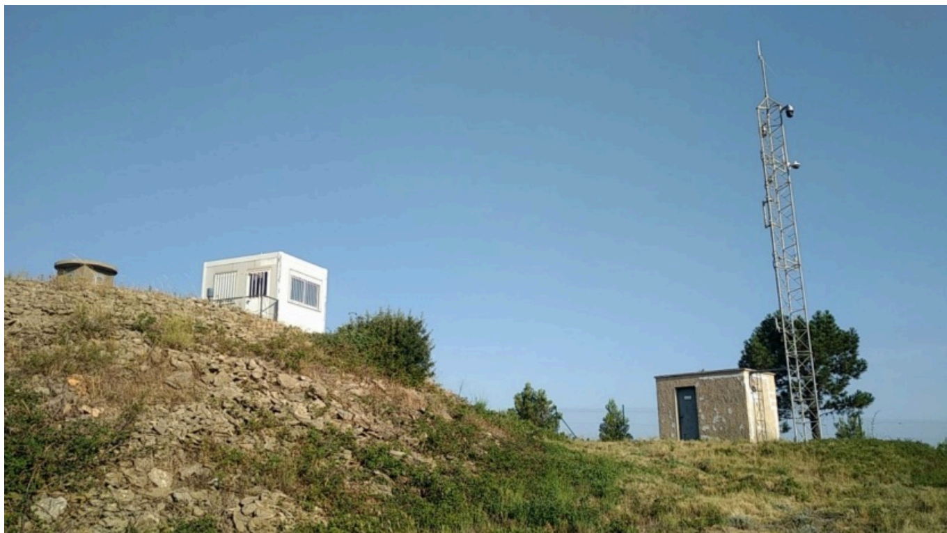
Exemple de caméra (à droite) installé au sein du département.

Au titre du Fonds vert, une subvention de 100 000 € a été octroyée par l'État pour l'acquisition des caméras, ainsi qu'une subvention de 70 000 € de la Région Sud. Le SDIS 84, quant à lui, a financé les caméras à hauteur de 184 000 €.