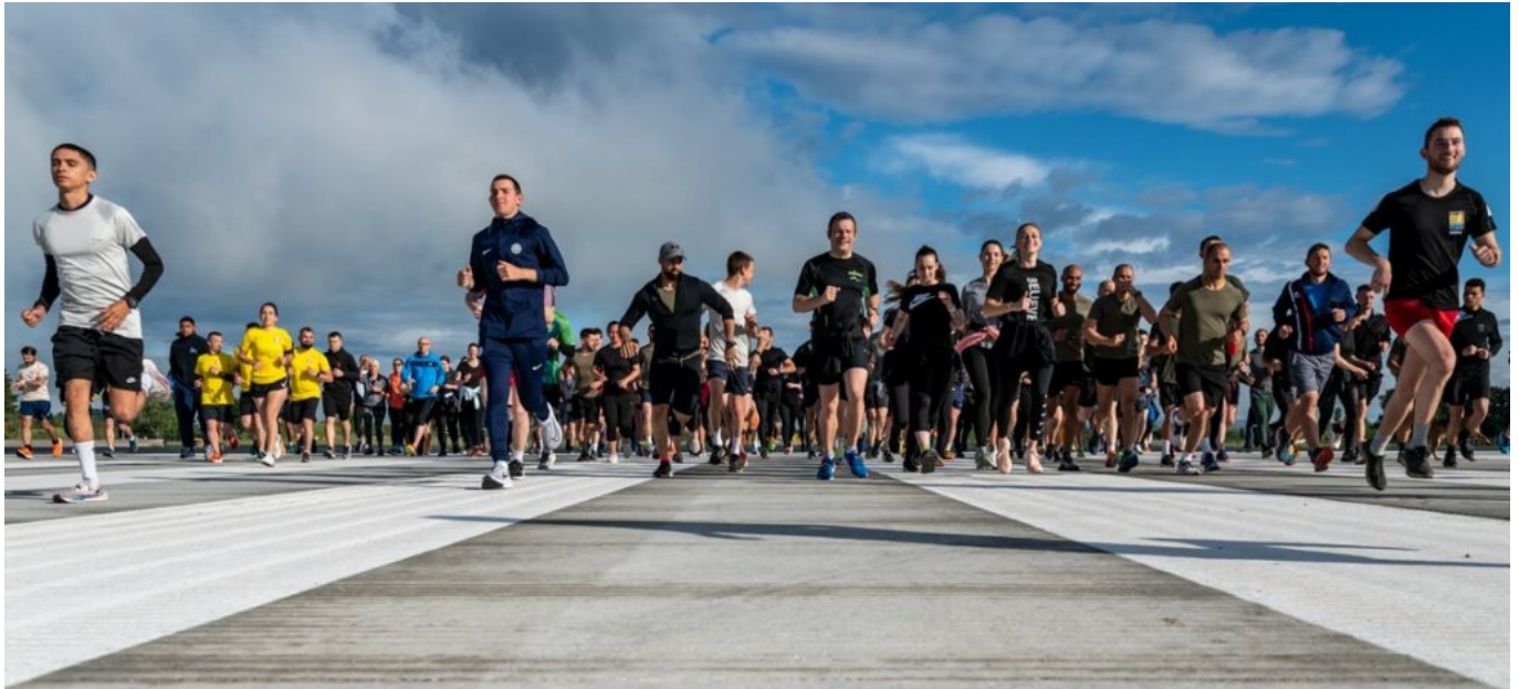
Les participants à la course sur la piste de la base.