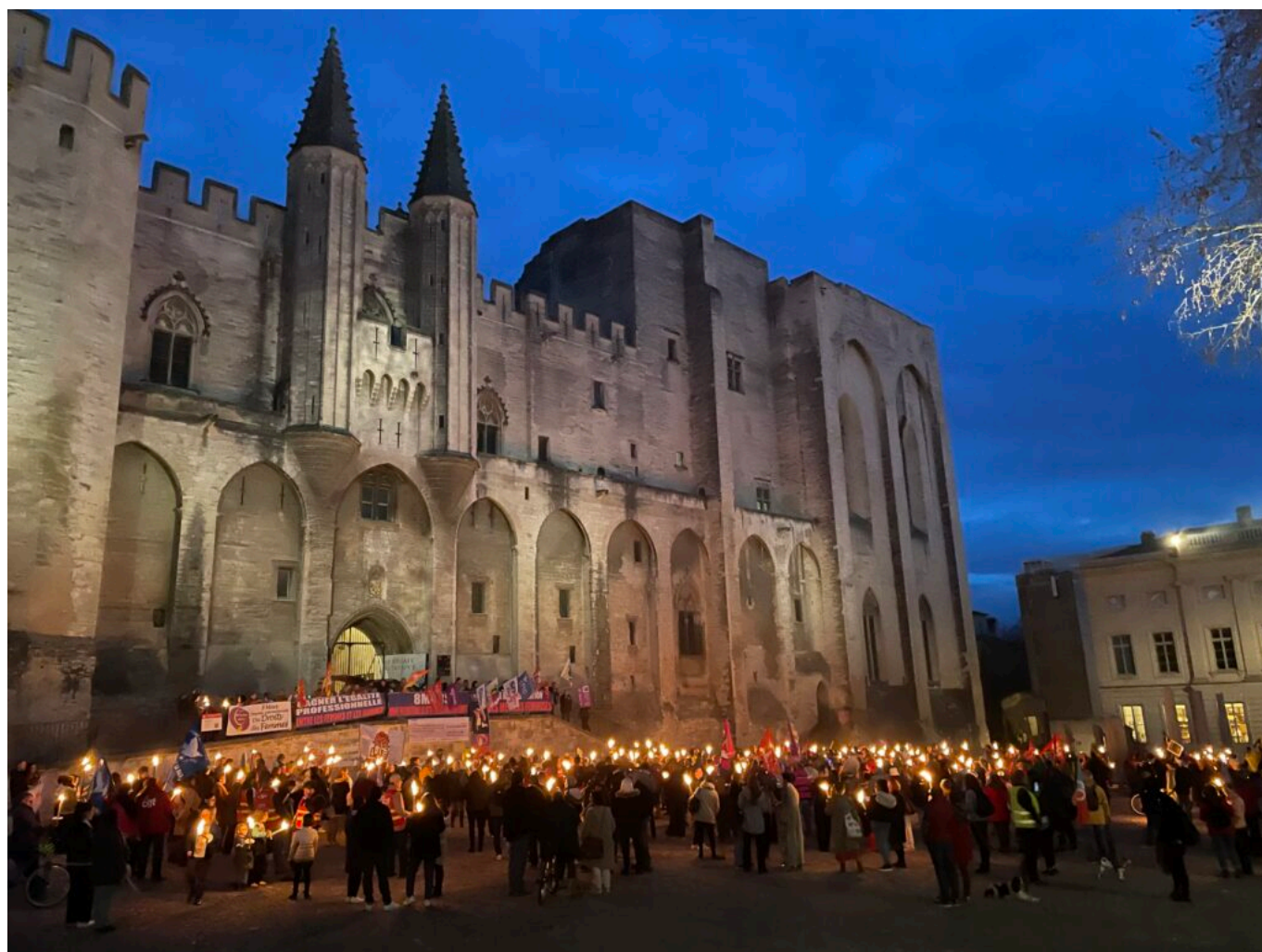
Manifestation au flambeau contre la réforme des retraites le soir du 8 mars devant le Palais des papes

Lucien Stanzione est membre de la Commission de la Culture, de l'éducation et de la communication et de la délégation aux Collectivités territoriales et à la décentralisation.