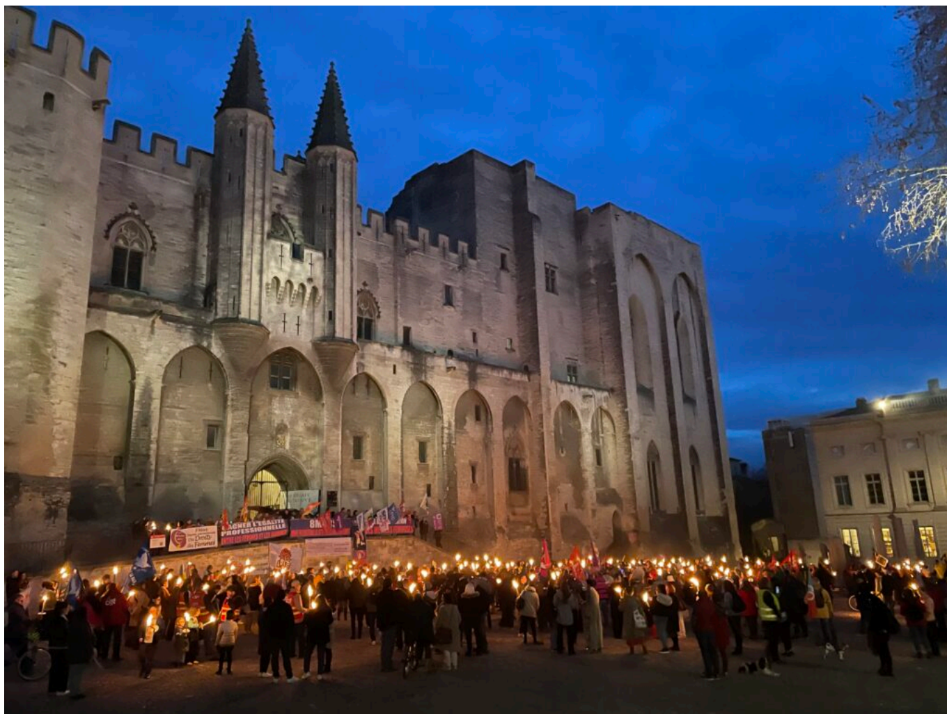
Manifestation au flambeau contre la réforme des retraites le soir du 8 mars devant le Palais des papes

Lucien Stanzione est membre de la Commission de la Culture, de l'éducation et de la communication et de la délégation aux Collectivités territoriales et à la décentralisation.