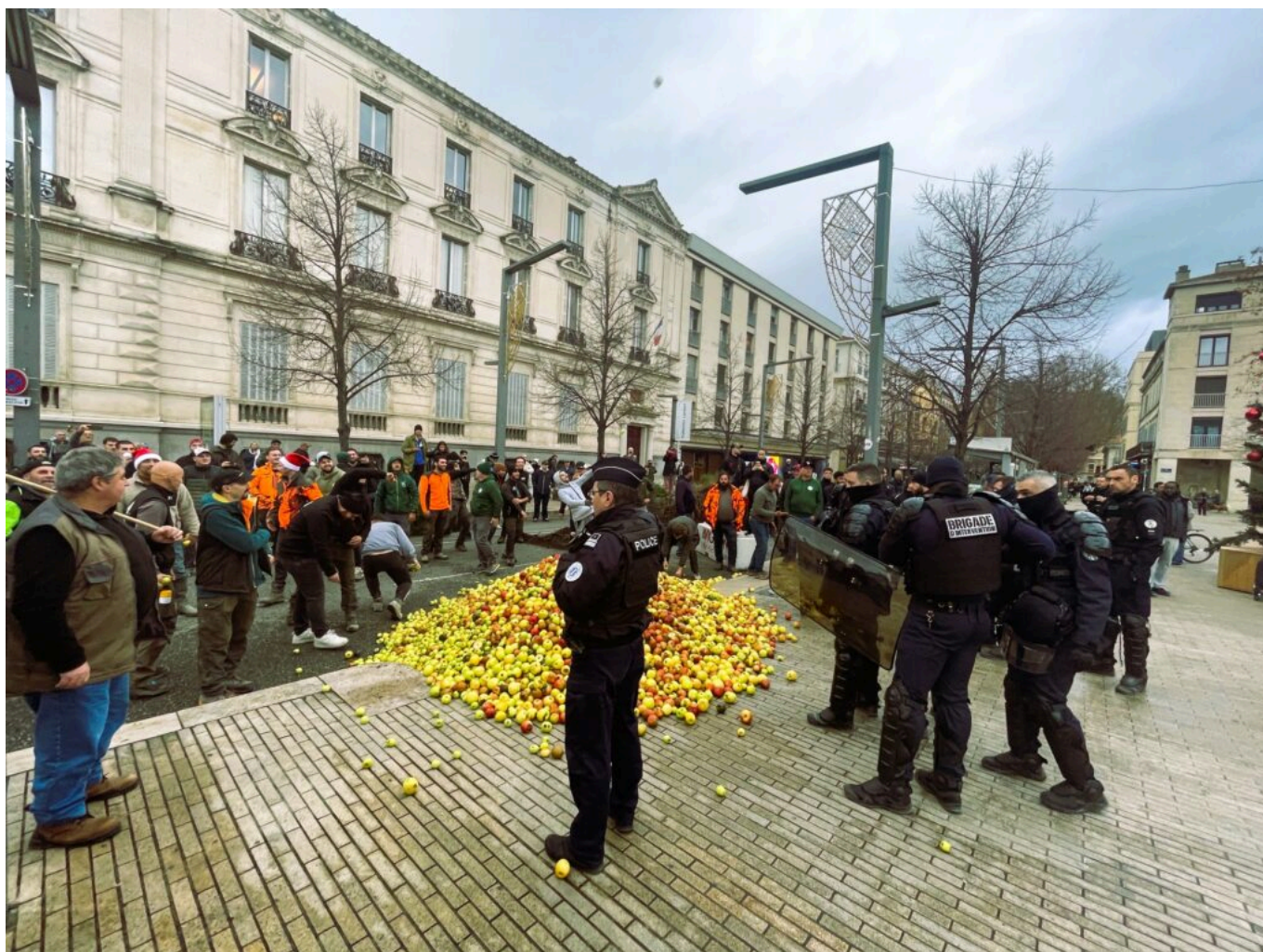
Manifestation des agriculteurs en décembre 2025 Cours Jean Jaurès Avignon