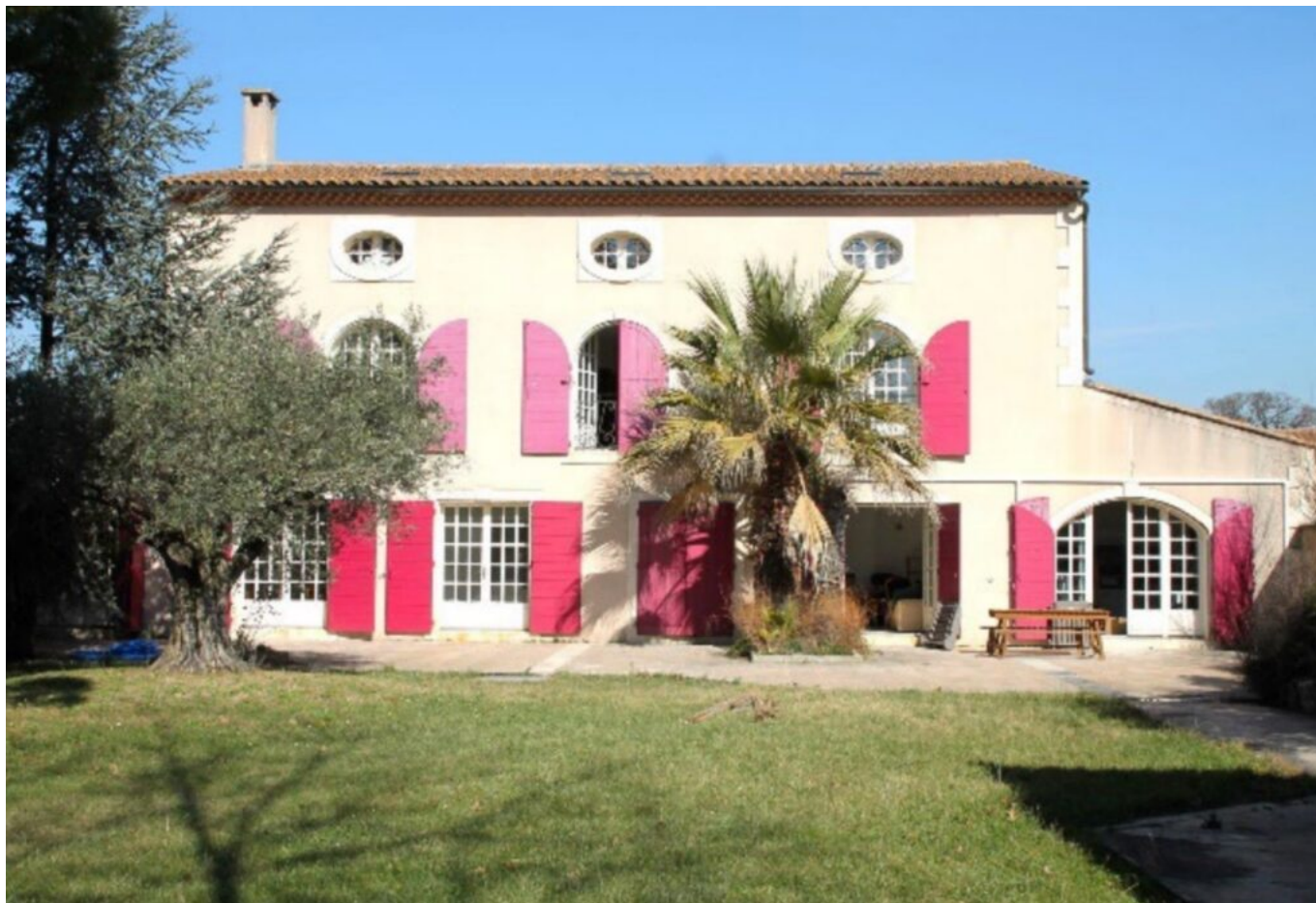
Maison partagée de Mollégès