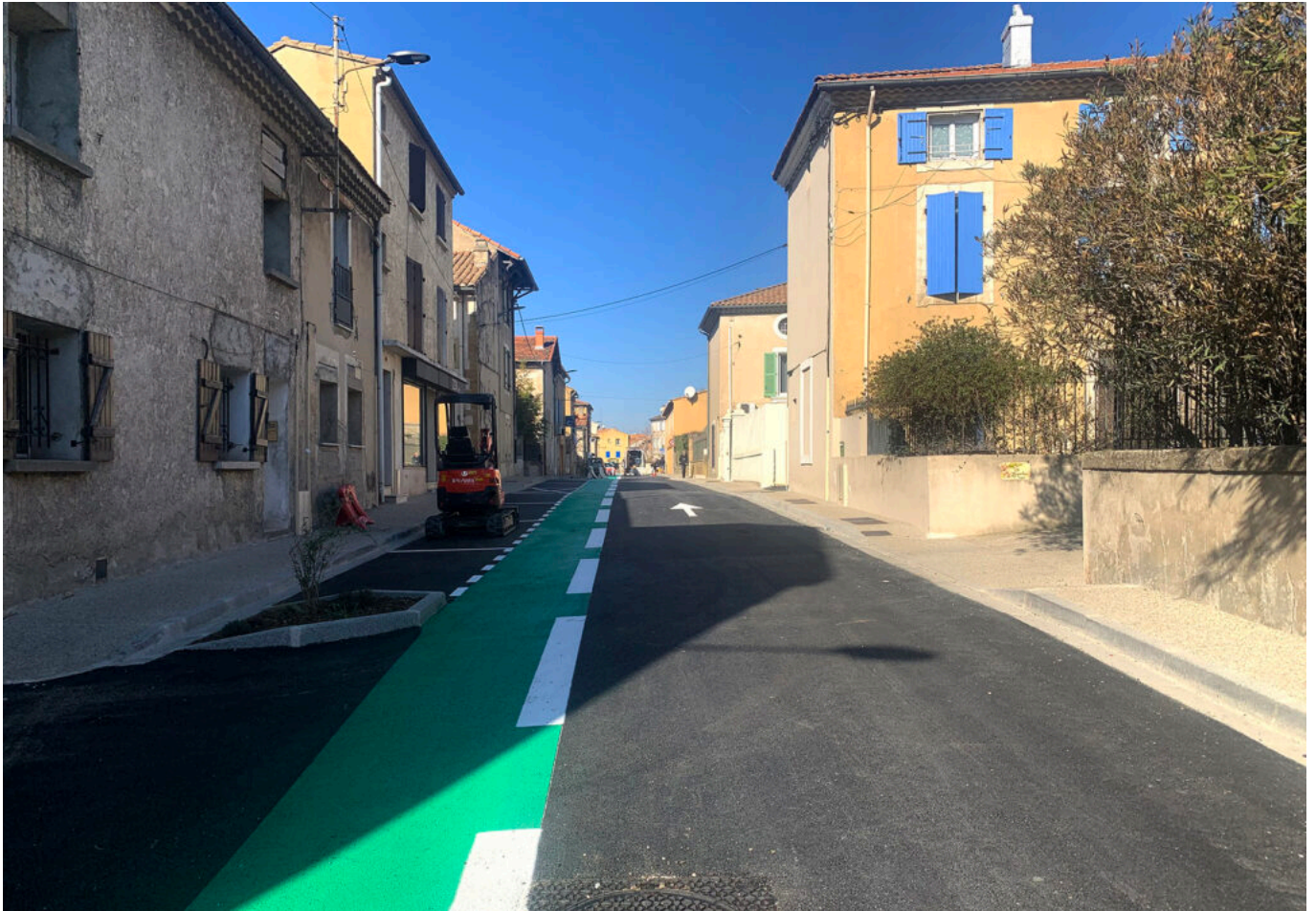
Ville de Sorgues