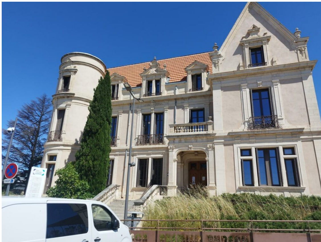
La société dans les bureaux du château Durbesson, en location à la Cove.

Les auxiliaires de vie ont un contrat de travail avec les familles, avec la convention collective du salarié du particulier employeur, ouvrant droit à un crédit d'impôt de 50 %. Le troisième contrat est un mandat entre l'auxiliaire de vie et l'agence, reprenant le cahier des charges du travail demandé et les compétences requises.