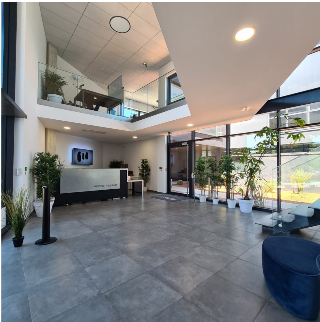
Nouveau siège social pour Stid.