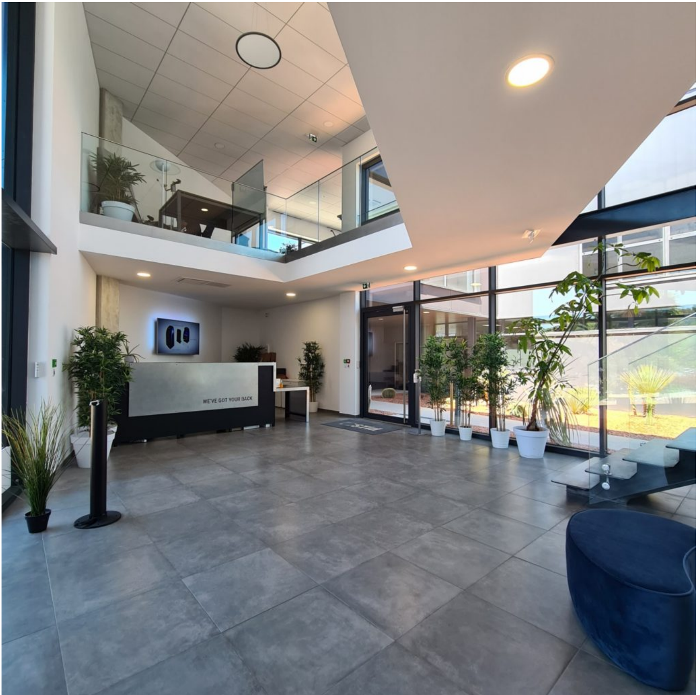
Nouveau siège social pour Stid.