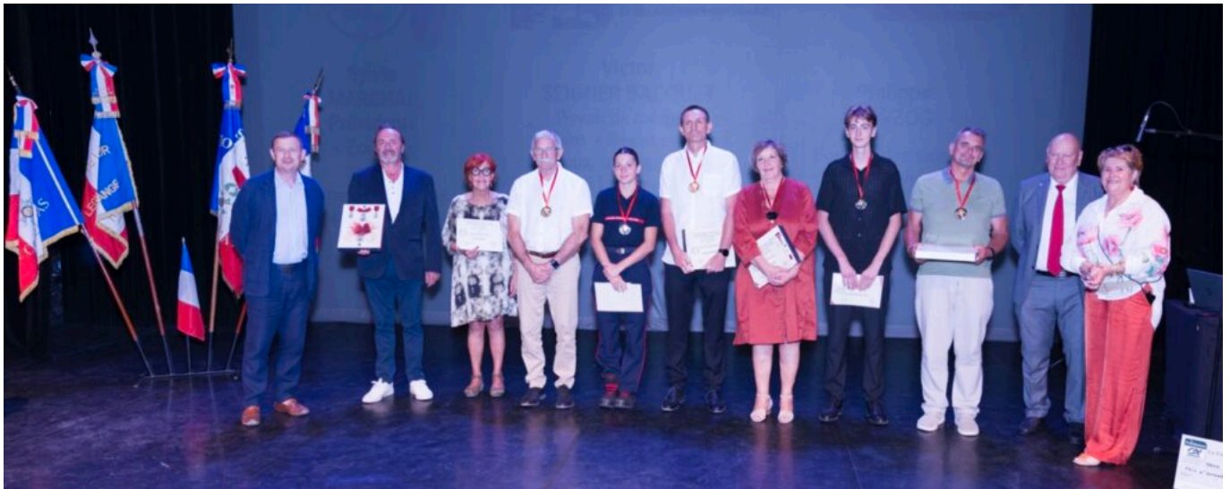
Les lauréats des Prix Inter-Générationnels.