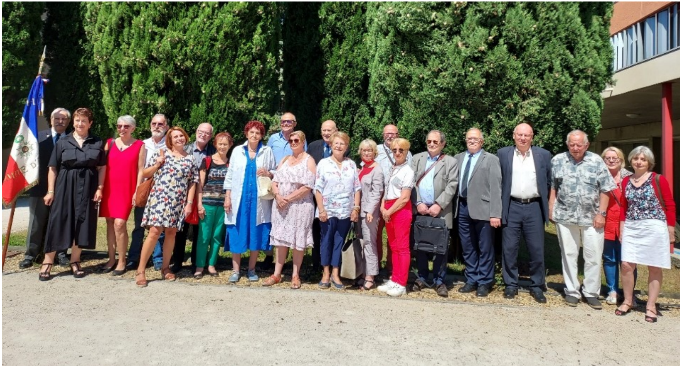
Les membres de la SMLH (Société des Membres de la Légion d'Honneur) de Vaucluse.