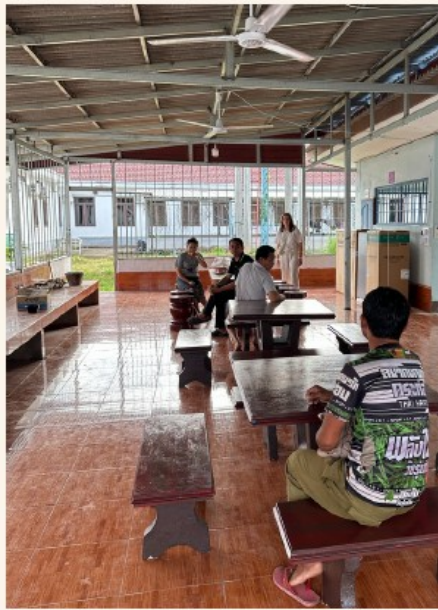
“Réfectoire de Sékong”