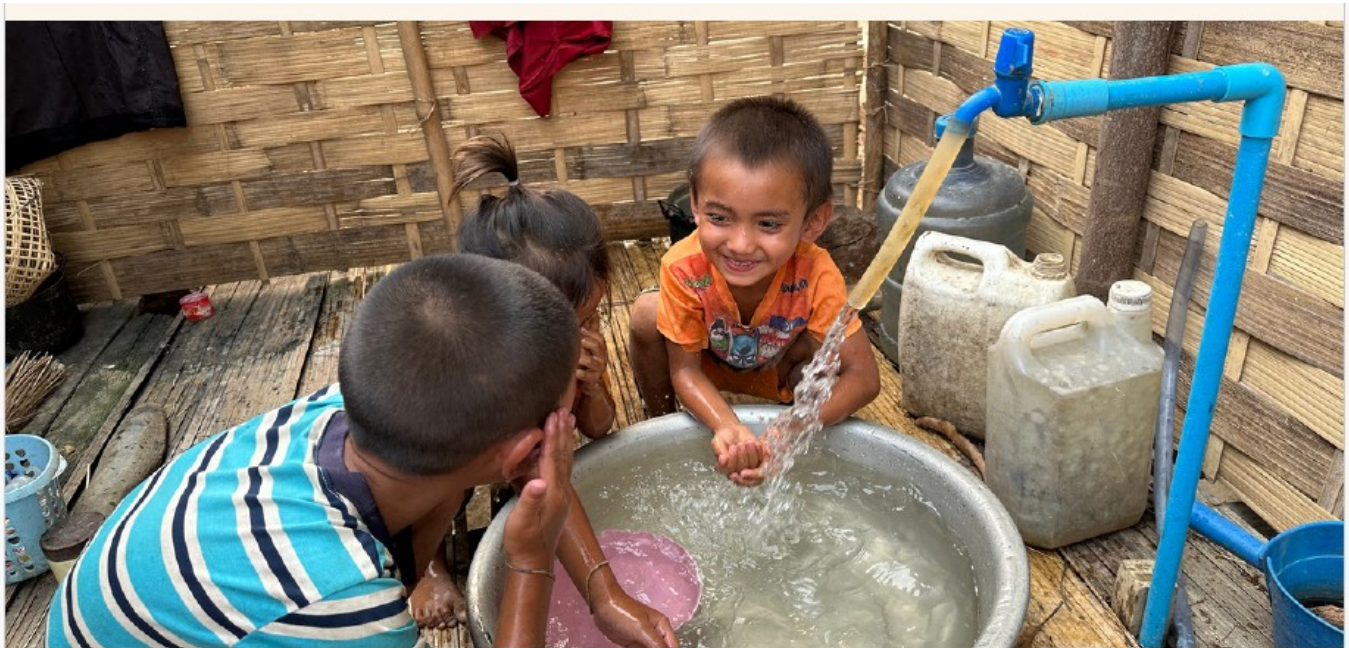
"Village de Na Luang"

construction de réservoirs, l'installation d'un réseau complet de distribution ainsi que de systèmes de filtration. Son coût est estimé à 24 000€, principalement en raison du relief montagneux, de la longueur des canalisations et des difficultés logistiques pour acheminer les matériaux jusque dans cette région reculée. Au-delà de l'amélioration immédiate des conditions de vie, l'accès permanent à l'eau doit également permettre le développement de cultures agricoles, notamment du café, afin d'offrir aux habitants de nouvelles perspectives économiques.