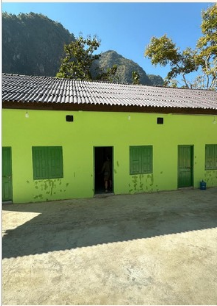
“Maternité à l’hôpital de Nong Khiaw”