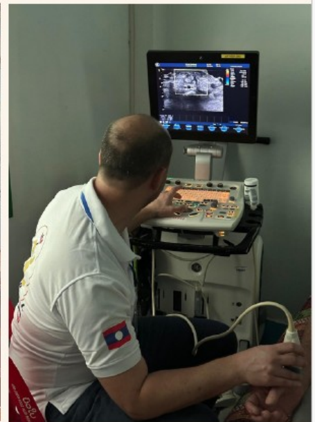
“Don d’un échographe pour l’hôpital de Nong Khiaw”