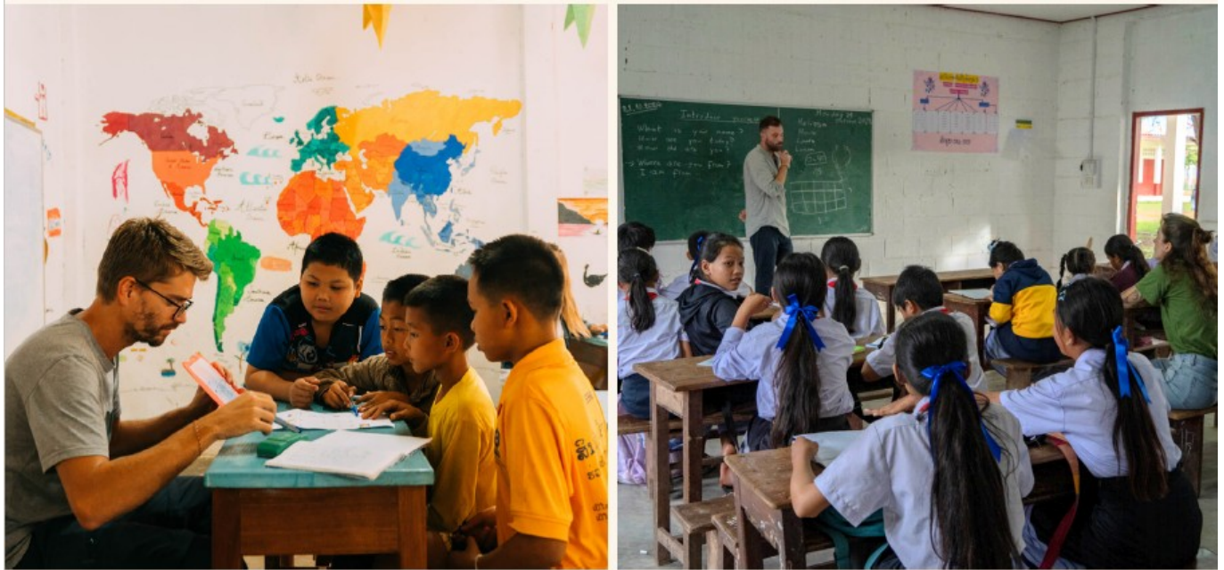
"NK English School"

l'automne afin d'inaugurer officiellement cette première réalisation aux côtés des villageois.