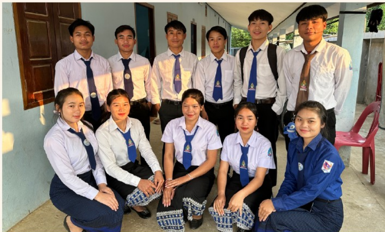
"Promo d'étudiants 2023 et 2024"