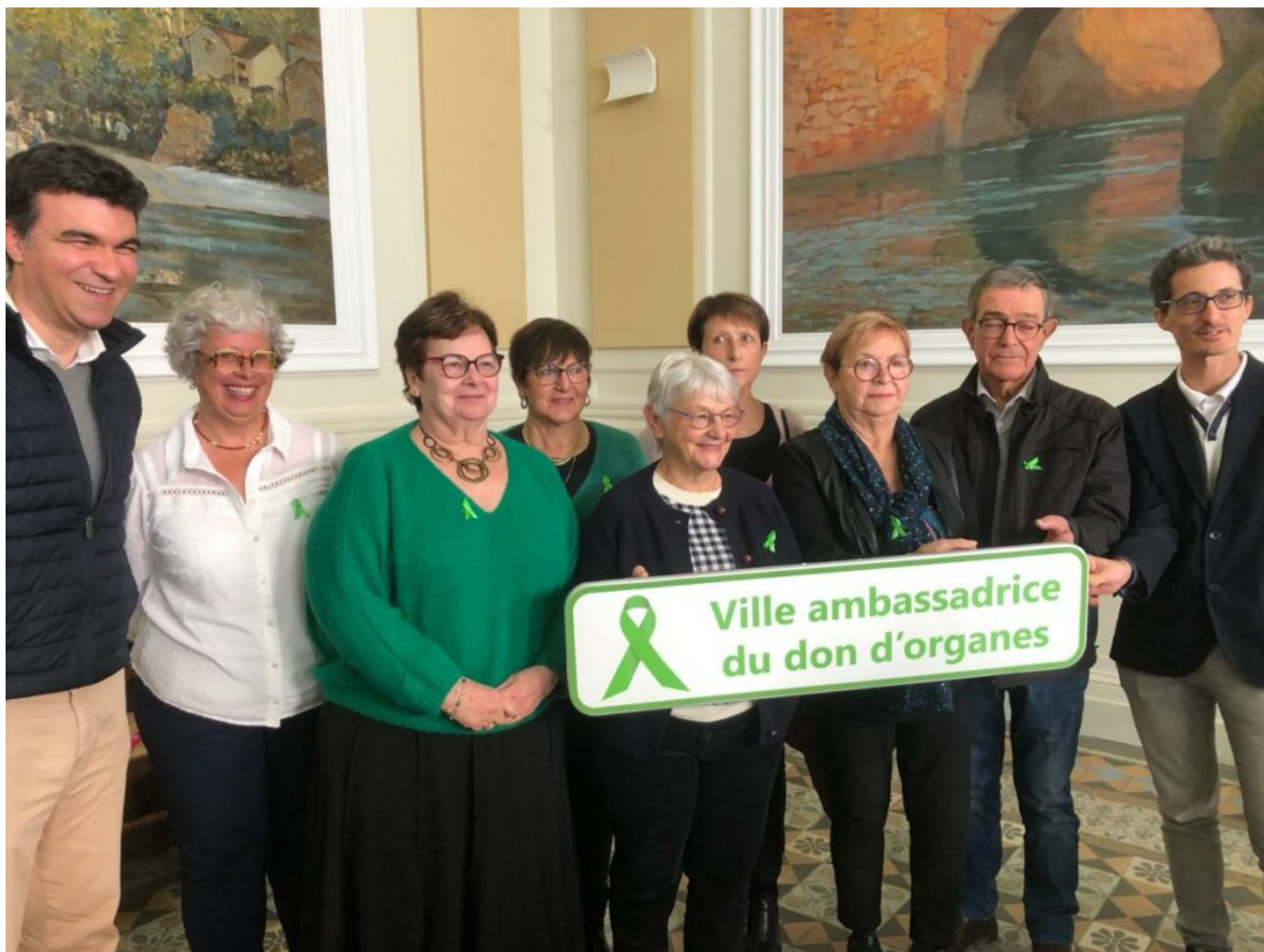
Les élus de Vaison-la-Romaine aux côtés des représentants du collectif Greffes+.

par des centaines de personnes chaque jour, ce qui permettrait à chacun de réfléchir au don d'organes et d'en parler en famille, telle est l'ambition de la commune de Vaison-la-Romaine.