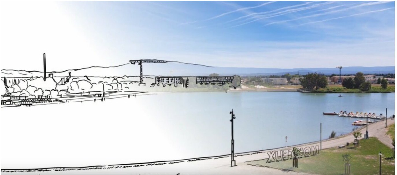
La zone de Beaulieu.

« Nous avons décidé de créer de la richesse. C'est ce que nous avons fait avec Beaulieu. »