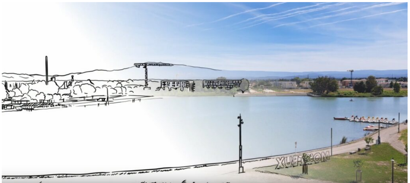
La zone de Beaulieu.

« Nous avons décidé de créer de la richesse. C'est ce que nous avons fait avec Beaulieu. »