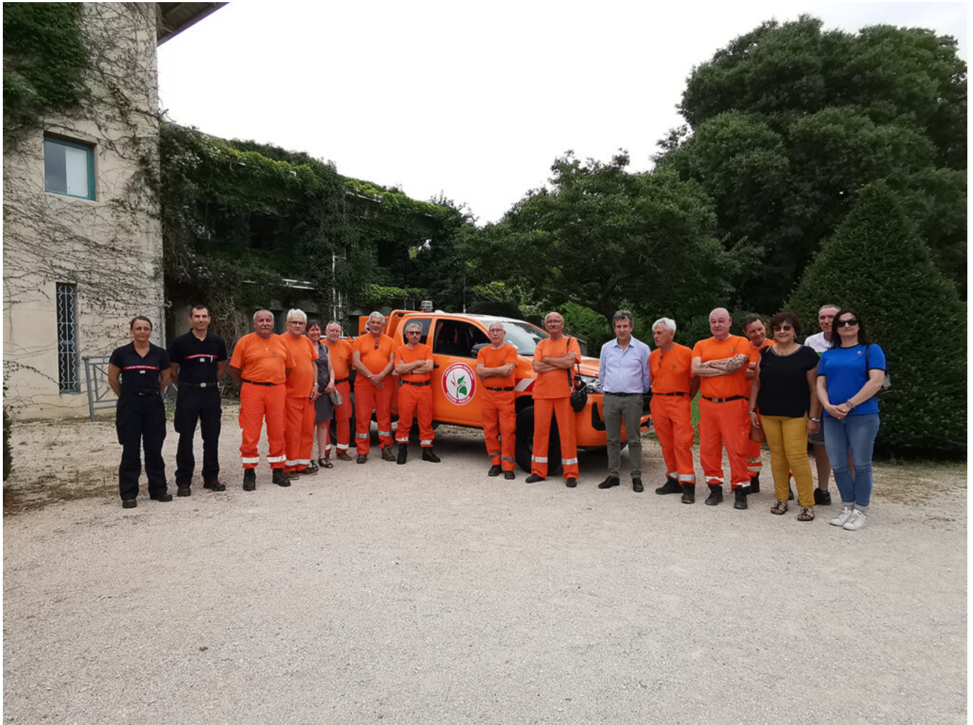
Véhicule CCFF

motopompe, un ensemble de tuyaux et de branchements adaptables aux bornes à incendie et une radio en liaison avec les vigies, les autres CCFF du territoire, les agents de l'Office national des forêts et la Police municipale.