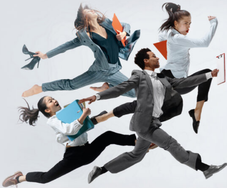
Illustration : Laurent Combarrière - Ville de Sorgues

GRATUIT MARDI 27 SEPTEMBRE SALLE DES FÊTES • SORGUES