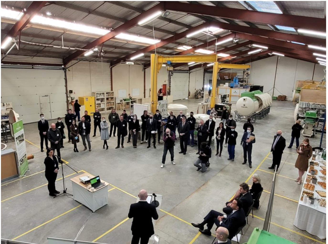
Présentation de Tricel au sein de l'usine de Sorgues.

C'est en 2016 que l'entreprise de construction de micro-stations d'épuration a choisi Sorgues pour implanter son second site français de fabrication et de distribution, après celui de Poitiers. Une implantation notamment réussie grâce au concours de l'agence économique Vaucluse Provence Attractivité et de l'agence irlandaise gouvernementale Enterprise Ireland .