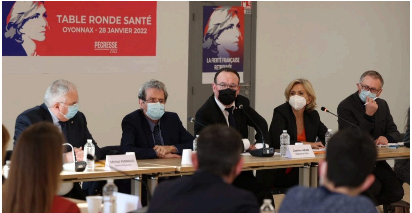
A Oyonnax, Alain Milon aux côtés de Valérie Pécresse et Philippe Juvin pour la présentation du programme santé.

L'agenda est pour le moins chargé. Un jour est dédié à la présentation du programme santé de Valérie Pécresse . Un autre prévoit une audition au Sénat sur l'adéquation du passe vaccinal à l'évolution de l'épidémie. Sans compter une question au gouvernement sur les Ehpad, sujet brûlant d'actualité. Le tout en observant ses obligations en tant que conseiller municipal de la commune de Sorgues, auprès de Thierry Lagneau qui l'a succédé en 2010 à la tête de la ville.