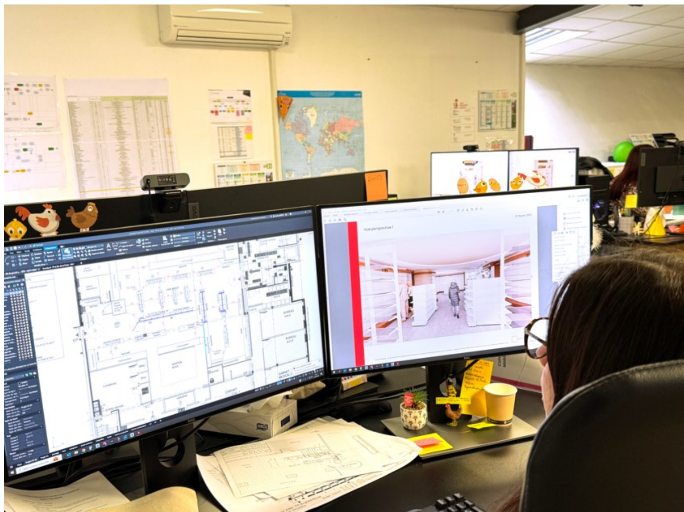
La conception de projets en bureau d'études

«Le chef d'entreprise marque de son empreinte l'entreprise et celle-ci est le prolongement moral du dirigeant, notamment lorsqu'il s'agit d'une petite entreprise de notre taille qui accueille 45 salariés pour un chiffre d'affaires, compris entre 10 et 11M€.»