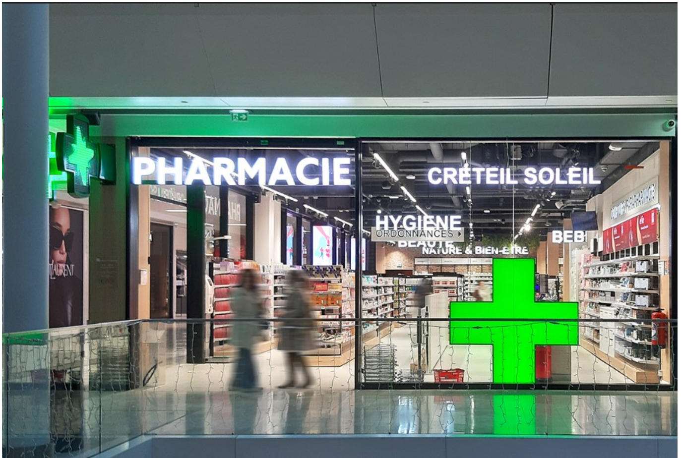
Exemple d'intervention sur une pharmacie

«J'étais salarié chez Michelin et, dans ce groupe important, totalisant plus de 140 000 salariés, je savais que je n'aurais pas accès à l'actionnariat. Mais le fait d'y travailler m'avait donné envie d'observer l'actionnariat dans le fonctionnement de l'entreprise. Quel impact celui-ci pouvait avoir dans la gestion d'une entreprise, en dehors d'une gestion dite familiale.»