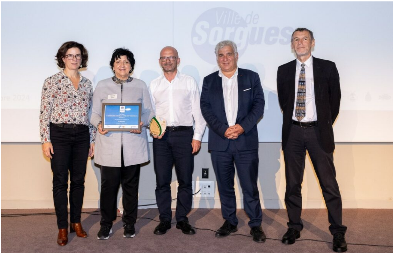
La commune de Sorgues reçoit son prix de niveau 1 dans la catégorie 'label Territoire Durable - Une COP d'avance'.

Pour rappel, depuis 2018 la commune d'Avignon (niveau 4), la Communauté de communes Pays des Sorgues Monts de Vaucluse (niveau 2), la Communauté d'agglomération du Grand Avignon (niveau 2), Carpentras (niveau 2), Châteauneuf-de-Gadagne (niveau 1) ainsi que Villedieu et Mirabeau (toutes deux labellisées 'Territoire engagé') ont également été distingués par l'Arbe.