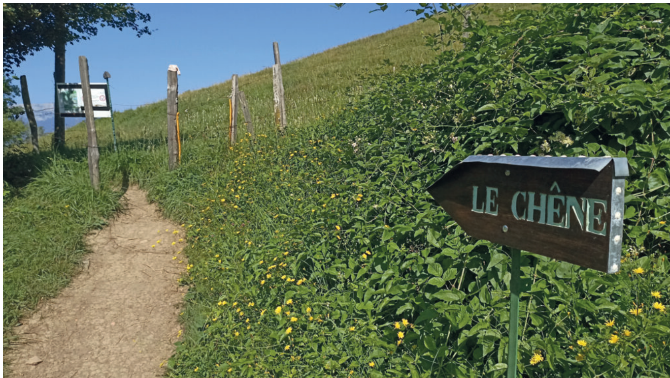
Une pancarte indique la direction du chêne de Venon