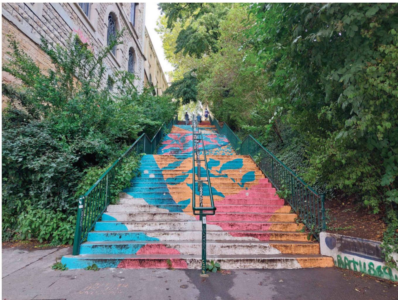
La montée des carmélites, un autre escalier hautement « instagrammable »

En arpentant les pentes, d'autres marches se sont parées de couleurs. Les escaliers de la montée des Carmélites, avec ses contremarches fleuries et vives, se lient très bien avec la végétation qui l'encadre. Cette fresque orange, bleu et rose a été réalisée en septembre 2022 par l'artiste Bambi Bakbi, mais aussi par des habitants. Au bout de l'escalier, le plus ancien jardin de Lyon et son amphithéâtre des trois Gaules attendent les visiteurs avec la verdure, le calme et le repos comme récompense. En poursuivant, on peut se rendre rue Saint-Polycarpe, où se cache une micro-brasserie, la Beer Fabrique. « Ici, c'est comme un cours de cuisine mais on fait de la bière », explique Lorris Martinengo, gérant et brasseur de l'établissement. Dans ces ateliers, les clients apprennent d'ailleurs des techniques de brassages qu'ils peuvent reproduire chez eux. Pour mieux aiguïser les papilles de ses visiteurs, la brasserie propose aussi des événements alliant cuisine et bière. Elle y a, par exemple, déjà décliné les thématiques de la gastronomie, du pâté en croûte ou des desserts.