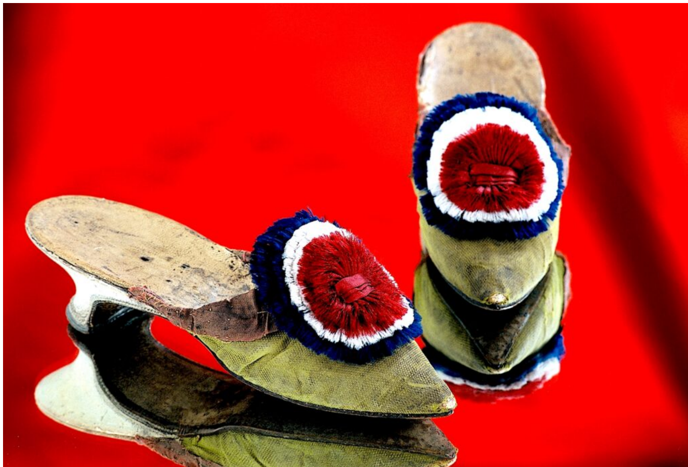
Des mules féminines révolutionnaires.