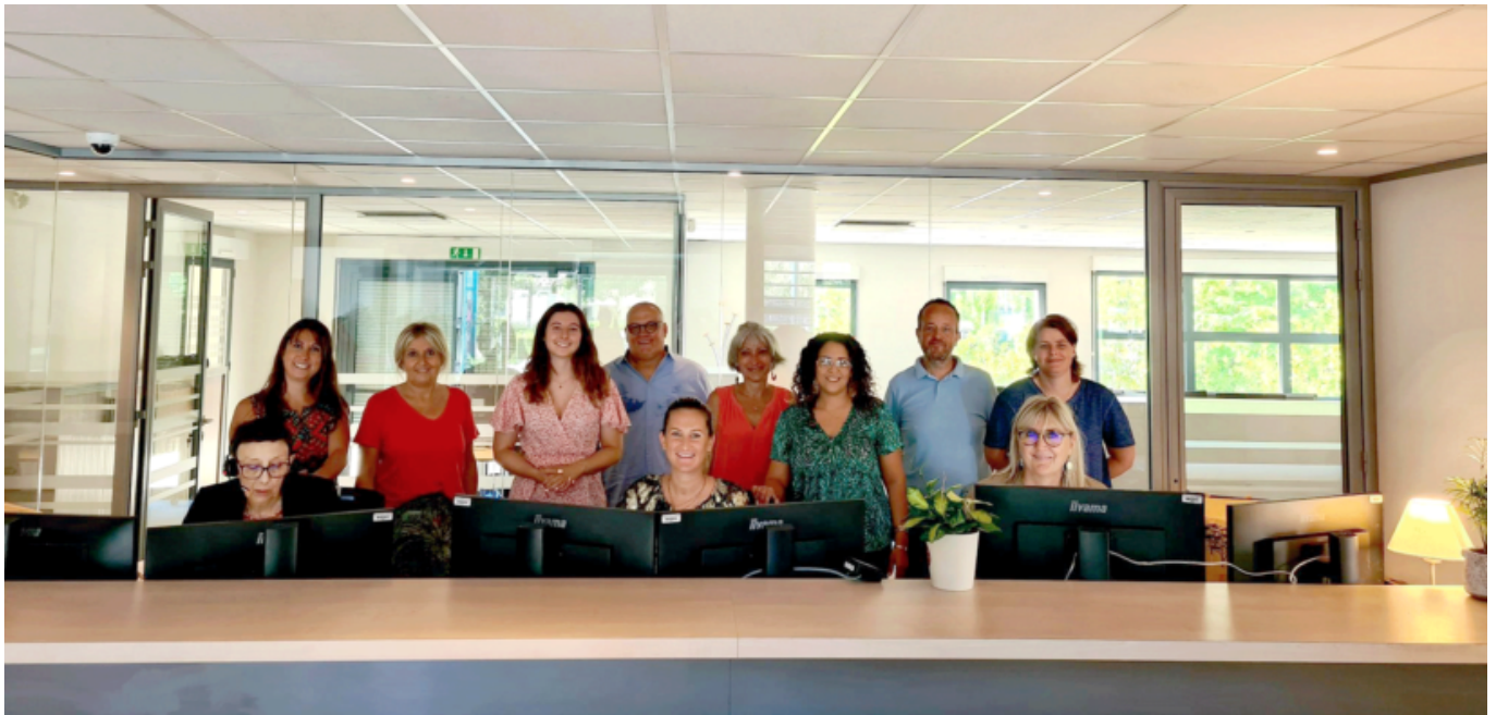
L'équipe GDH de la nouvelle agence des sources