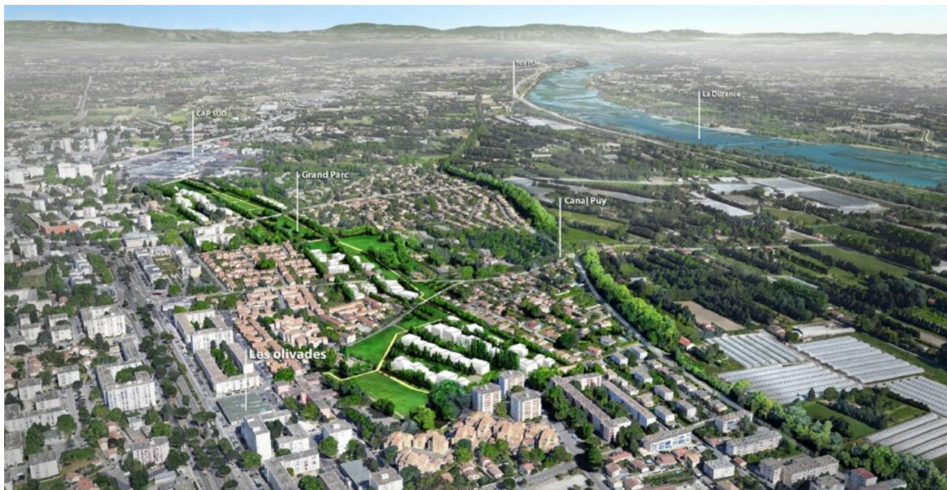
L'éco-quartier de Joly-Jean.